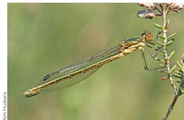
Kim Huskens Figuur 4. Vrouwtje gewone pantserjuffer.