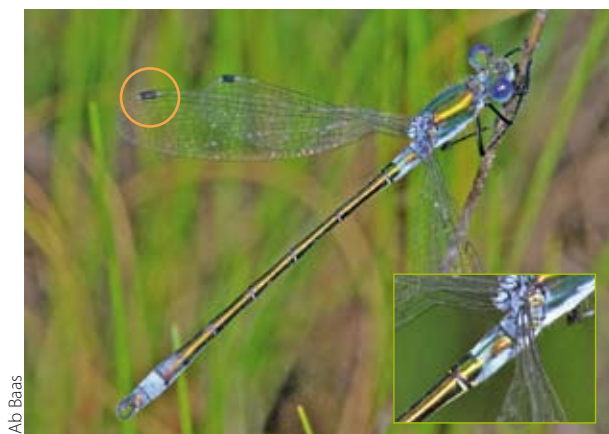
Ab Baas Figuur 3. Mannetje tangpantserjuffer. Let op de blauwe berijping op het achterlijf en de donkere pterostigma's met licht randaders. Inzetje: vorm van blauwe berijping op segment 2.

De tengere pantserjuffer is een kleine, slank gebouwde pantserjuffer. Mannetjes en vrouwtjes: de achterkant van de ogen (kop van achter bekijken) is tweekleurig: er is een duidelijke grens aanwezig tussen een donkere bovenkant en een gele onderkant (inzetje figuur 5). De pterostigma's van uitgekleurde dieren zijn eenkleurig lichtbruin, maar hebben opvallende lichte randaders. Mannetjes (figuur 5): uitgekleurde exemplaren hebben een stukje blauwe berijping aan de punt van het achterlijf (segment 9 en 10), maar niet aan de basis van het achterlijf, zoals bij de gewone en de tangpantserjuffer. Verder zijn de onderste achterlijfsaanhangselen zeer kort en recht. Vrouwtjes: geen blauwe berijping. Het legapparaat heeft 'normale' proporties: de achterrand steekt in zijaanzicht niet voorbij de achterrand van het laatste achterlijfsegment.