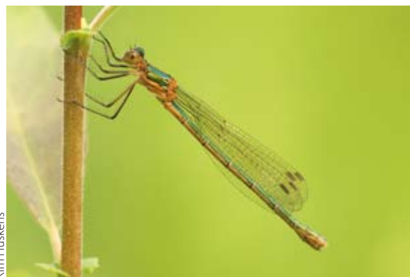
Kim Huskens Figuur 2. Vrouwtje gewone pantserjuffer.