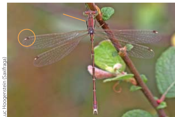
Figuur 6. Mannetje zwervende pantserjuffer. Berijping op het achterlijf ontbreekt. Let op de rode kleur en lichte achterlijfspunt, de duidelijke schoudernaadstreep en de tweekleurige pterostigma's.