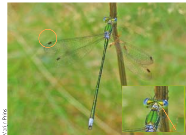
Marijn Prins Figuur 5. Mannetje tengere pantserjuffer. Alleen de achterlijfspunt is blauw berijpt. Pterostigma's donker met lichte randaders. Inzetje: detail tweekleurige kop.