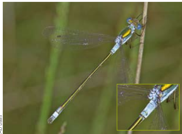
Ab Baas Figuur 1. Mannetje gewone pantserjuffer. Let op de blauwe berijping op het achterlijf en de donkere pterostigma's. Inzetje: vorm van blauwe berijping op segment 2.

De gewone pantserjuffer is de meest algemene pantserjuffer van Nederland, met een gemiddeld formaat. Mannetjes en vrouwtjes: de achterkant van de kop is donker: er is geen duidelijke grens aanwezig tussen een donkere bovenkant en een gele onderkant van de kop. De pterostigma's van uitgekleurde dieren zijn eenkleurig donker. Mannetjes (figuur 1): uitgekleurde exemplaren hebben een stukje blauwe berijping aan de basis van het achterlijf (segment 1 en 2) en aan de punt van het achterlijf (segment 9 en 10). Segment 2 is bijna geheel berijpt, hoewel de berijping naar achter toe (van het borststuk af) steeds vager wordt. Er is echter geen scherpe grens aanwezig tussen een berijpt en een onberijpt deel van segment 2 (inzetje figuur 1). Onderste (binnenste) achterlijfsaanhangselen lang en recht; ze lopen geleidelijk schuin naar elkaar toe (figuur 7). Vrouwtjes: geen blauwe