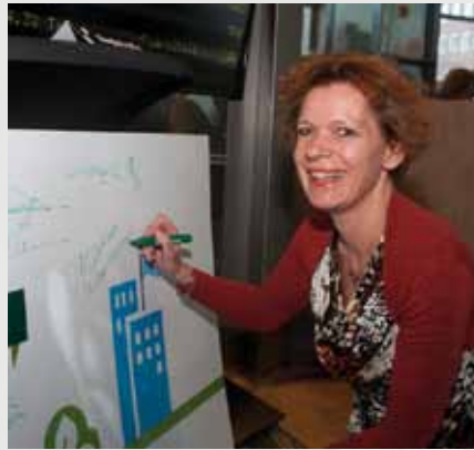
In december tekende De Vlinderstichting de Green Deal 'Tijdelijke Natuur' met de overheid en enkele haven- en ontgrondingsbedrijven.

Om vlinders en libellen te beschermen, is het belangrijk te weten waar ze voorkomen. Daarom doet De Vlinderstichting overal in Nederland onderzoek. Daarbij wordt zoveel mogelijk samengewerkt met andere organisaties.