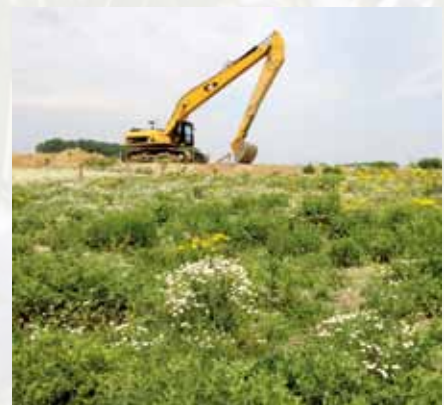
In opdracht van Cascade, vereniging van zand- en grindproducenten zijn twee afgravingen met dagvlinder- en libelleninventarisaties onderzocht op de kwaliteit van nieuwe natuur.