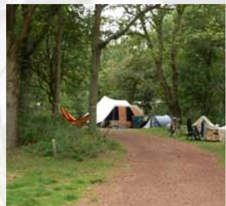
In oktober hebben De Vlinderstichting en camping Geversduin een samenwerkingsovereenkomst getekend. Op de duurzame camping worden verschillende aanpassingen gedaan om het terrein nog vlindervriendelijker te maken.