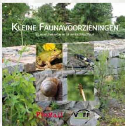
In de 2011 opgezette samenwerking tussen de VOFF en Prorail is een brochure ontwikkeld voor extra voorzieningen bij faunapassages.