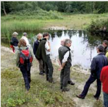
De Vlinderstichting heeft op 29 mei 2011 de Ravenvennen uitgeroepen tot libellenreservaat. In juni kreeg ook het Kuinderbos (foto) het predikaat libellenreservaat.