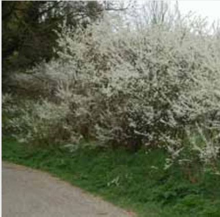
In 2011 zijn de verspreiding en kansen van de sleedoornpage voor de gemeente Ede in kaart gebracht.