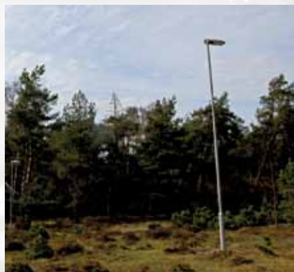
Samen met het NIOO, Wageningen Universiteit en de VOFF en de bedrijven Philips en de Nederlandse Aardolie Maatschappij doet De Vlinderstichting onderzoek naar het effect van kunstlicht op natuur.