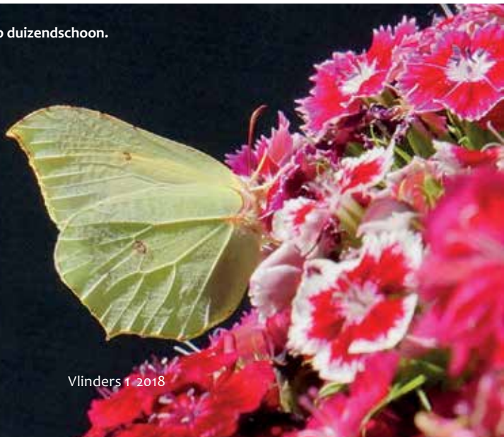
Citroenvlinder op duizendschoon.

Damastbloem ( Hesperis matronalis ) is verwant aan de judaspenning. Deze plant is inheems in Zuid- en Centraal-Europa. Het is net als de judaspenning een waardplant voor het oranjetipje en andere leden van de koolwitjesfamilie, maar hij bloeit wat later. Mede omdat het allebei waardplanten zijn, hebben ze een meerwaarde voor vlinders. Of hun nectar beter is voor de vlinder dan de nectar van bijvoorbeeld een zinnia of dahlia? Ik zou het niet weten. Zinnia's en dahlia's zijn echte cultuurplanten, die toch vlinders lokken. Maar ja, als je voor kinderen een groentesapje