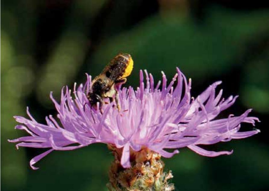
Knooppkruid met wilde bij.

meer je van eenzelfde soort plant, hoe groter de kans op vlinderbezoek. Dat heb ik dit jaar ervaren met de Chinese bieslook, die na zes jaar in de tuin een flink aantal bloemen produceerde en waarop ik voor het eerst een vlinder heb gezien. Wat dat betreft zijn vlinders net mensen: hoe groter de winkel of hoe meer winkels van dezelfde soort, des te groter de kans op publiek.