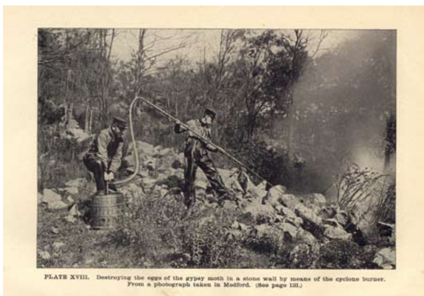
Figuur 3. De 'cyclone burner' een soort primitieve vlammenwerper werd ingezet om de eieren in muurspleten te vernietigen. Foto genomen in Medford [p 117]

Gerardi M.H. & J.K. Grimm (1979). The history, biology, damage, and control of the gypsy moth Porthetia dispar (L.). Fairleigh Dickinson UP, Rutherford. ●