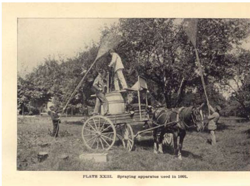
Figuur 2. Bespuitingen – levensgevaarlijk voor man en paard, en weinig effectief [p 137]. Veel later zijn natuurlijk ook DDT en andere chemische bestrijdingsmiddelen massaal gebruikt tegen de plakker.

Het lijkt geen twijfel dat Trouvelot zorgvuldig heeft gehandeld. Niettemin veroorzaakte hij een ramp van moeilijk te evenaren omvang. In onze streken is de plakker geen lieverdje in de bosbouw, maar als plaag is de soort in Europa niet te vergelijken met waartoe hij in Amerika in staat is. De les is dus dat het overbrengen van een soort naar een ander deel van de wereld met een vergelijkbaar klimaat een onvoorspelbaar risico van mogelijk enorme omvang in zich bergt. Daarom zou het een vast beleid moeten zijn van elke overheid dat