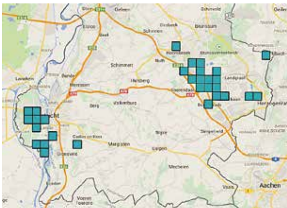
Waarnemingen van de iepenpage in Zuid-Limburg. De twee metapopulaties zijn duidelijk te herkennen.

Is de iepenpage nu uit Tienvoor12!? Doel van deze campagne is te bereiken dat er van een soort meer dan tien populaties in Nederland zijn. In 2013 en 2014 zijn 37 vindplaatsen vastgesteld, maar dat zijn nog geen losse populaties. Waar de exacte grenzen van een populatie liggen, zullen we komende jaren moeten bepalen. We denken dat we in Limburg te maken hebben met twee metapopulaties en in de Achterhoek mogelijk één. Dat houdt deze soort voorlopig nog binnen de kaders van Tienvoor12! De zoekacties op de lijn Heerlen – Gulpen hebben helaas nog geen vlinders opgeleverd. Het vermoeden is dat de soort via Heerlen – Hoensbroek – Schinnen zich naar het noordwesten uitbreidt en mogelijk aansluiting vindt via Elsloo – Bunde – Maastricht. In de Achterhoek zijn bij benadering vijf kernen gevonden met iepenpages die zich verdelen over zeven kilometerhokken. De vondsten uit het verleden bij Eindhoven en Nijmegen bieden, na deze ervaringen, nog altijd toekomstperspectief. ●