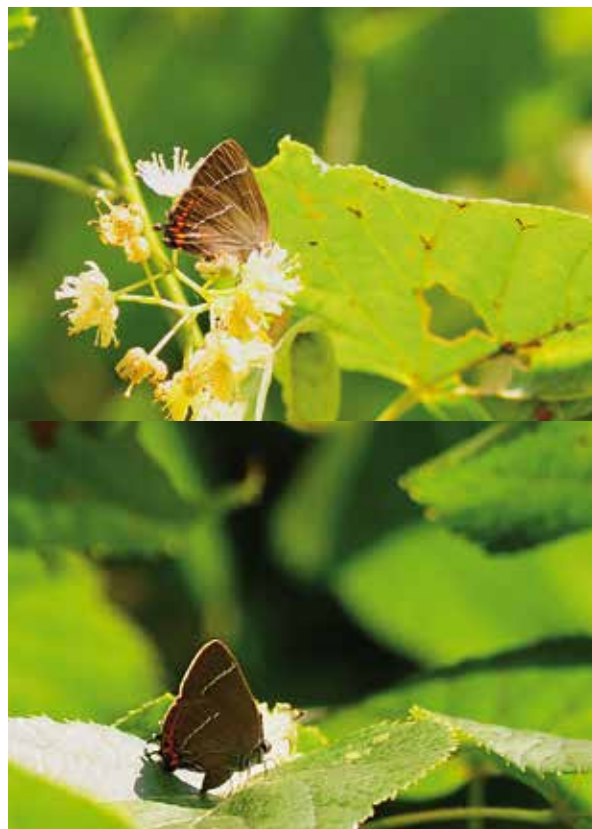
Iepenpage mannetje (boven) en vrouwtje (onder).

We weten nu ook waar de iepenpage zich het liefst