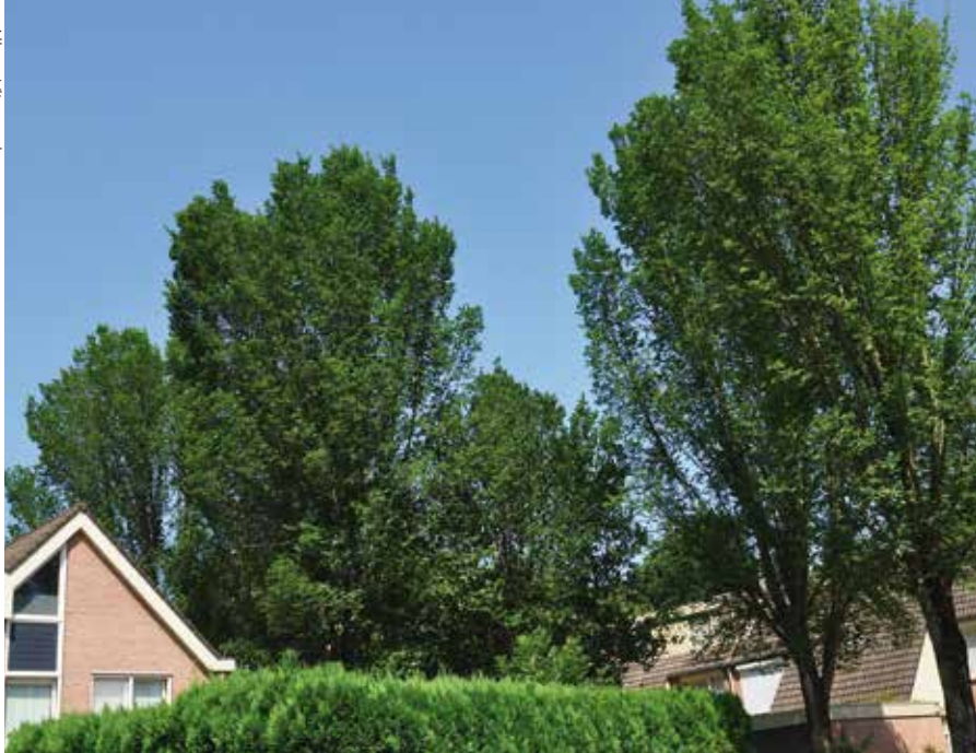
Iepen in Heerlense woonwijk met een gezonde populatie iepenpage-populaties zijn duidelijk te herkennen.

ophoudt in de boom, en dat bij grotere bezetting de vrouwtjes juist graag naar beneden komen, terwijl de mannetjes boven in de toppen hun territorium blijven bewaken.