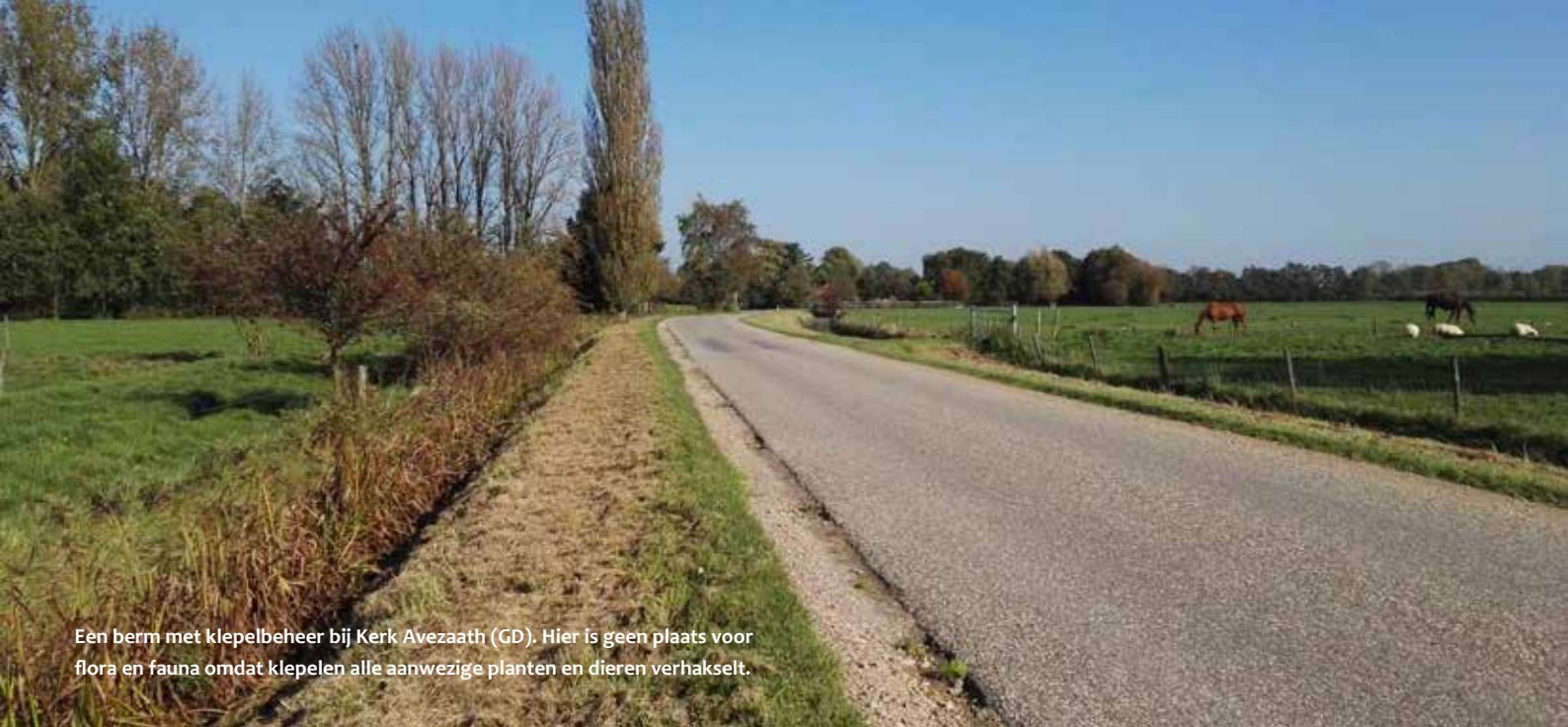
Een berm met klepelbeheer bij Kerk Avezaath (GD). Hier is geen plaats voor flora en fauna omdat klepelen alle aanwezige planten en dieren verhakselt.