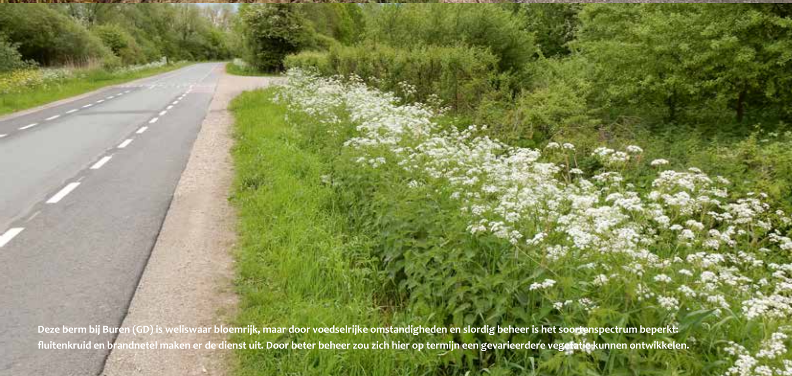
Deze berm bij Buren (GD) is weliswaar bloemrijk, maar door voedselrijke omstandigheden en slordig beheer is het soortenspectrum beperkt: fluitenkruid en brandnetel maken er de dienst uit. Door beter beheer zou zich hier op termijn een gevarieerdere vegetatie kunnen ontwikkelen.