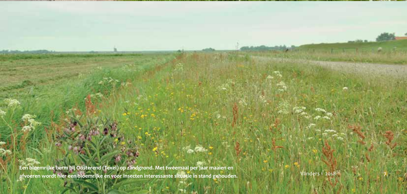
Een bloemrijke berm bij Oosterend (Texel) op zandgrond. Met tweemaal per jaar maaien en afvoeren wordt hier een bloemrijke en voor insecten interessante situatie in stand gehouden.