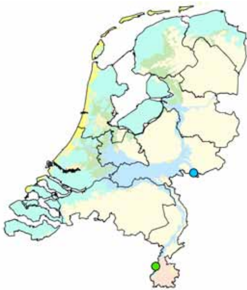
De onderzochte locaties. Groene stip: Meers; blauwe stip: de Omsteg.

Uit het onderzoek blijkt dat goed beheer van de opgeleverde natuur de natuurwaarde hoog kan houden en zelfs kan doen toenemen. De variatie in leefgebied is bepalend voor de biodiversiteit. Opgeleverde natuur door zand- of grindwinning start vrijwel altijd met een pioniersituatie en kent altijd een natuurlijke successie. Deze pioniersituaties zijn een belangrijk leefgebied voor veel soorten die in Nederland onder druk staan. Onze graslandvlinders zijn een goed voorbeeld hiervan. Keuzes voor het terreinbeheer na de winning van grondstoffen zullen moeten worden gemaakt om kwalitatieve natuur na te streven. Dit is namelijk niet verplicht. Sinds de oplevering van nieuwe natuur bij De Omsteg is het gebied direct goed onderzocht en blijkt dat het aantal soorten vlinders en libellen hier is toegenomen.