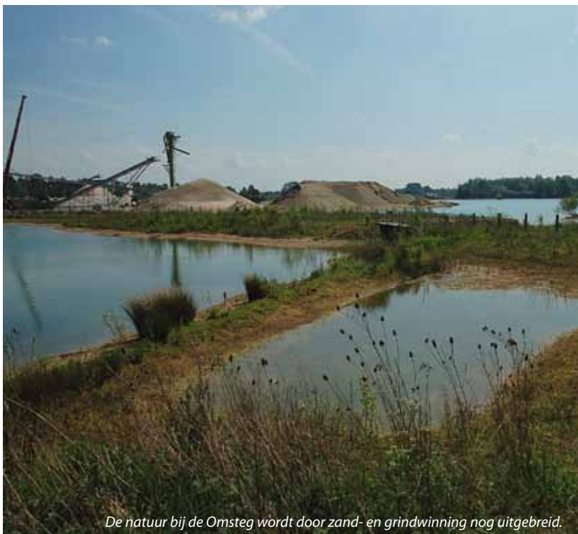
De natuur bij de Omsteg wordt door zand- en grindwinning nog uitgebreid.

Het onderzoek van De Vlinderstichting wijst uit dat de natuurwaarde in beide gebieden hoog is. Belangrijker nog is dat beide gebieden een stapsteenfunctie in de omgeving vormen. Gegevens uit de Nationale Databank Flora en Fauna (NDFF) laten zien dat de gevonden soorten vrijwel ontbreken in de directe omgeving van de winlocaties. Vlinders van bloemrijke graslanden en pioniersituaties zoals het bruin blauwtje en zwartsprietdikkopje kunnen zich vanuit De Omsteg naar de directe omgeving verplaatsen. De waterkwaliteit is hier gunstig en men ziet daarom steeds meer bijzondere libellen. Enkele noemenswaardige soorten zijn de plasrombout, de vuurlibell en de kanaaljuffer. Ook in het dynamische systeem bij Meers komen bijzondere insecten voor. De koninginnenpage is er inmiddels een gewone verschijning, maar ook de zeldzame zuidelijke keizerlibell werd hier gezien.