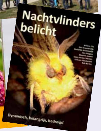
Dynamisch, belangrijk, bedreigd