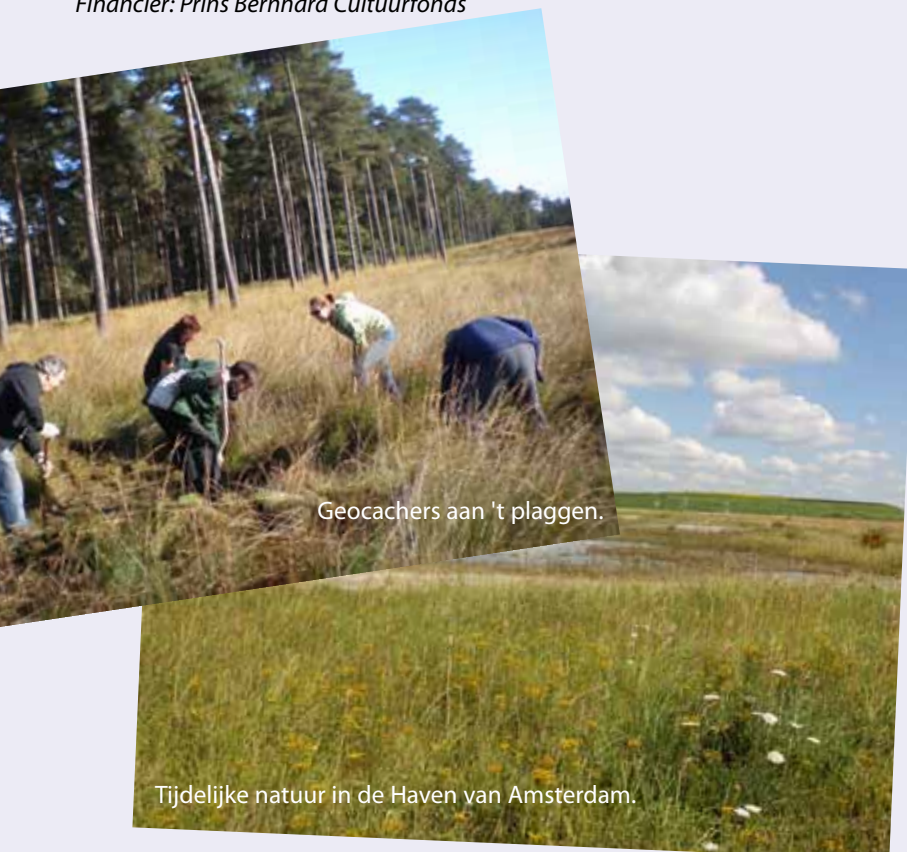
Geocachers aan 't plaggen.