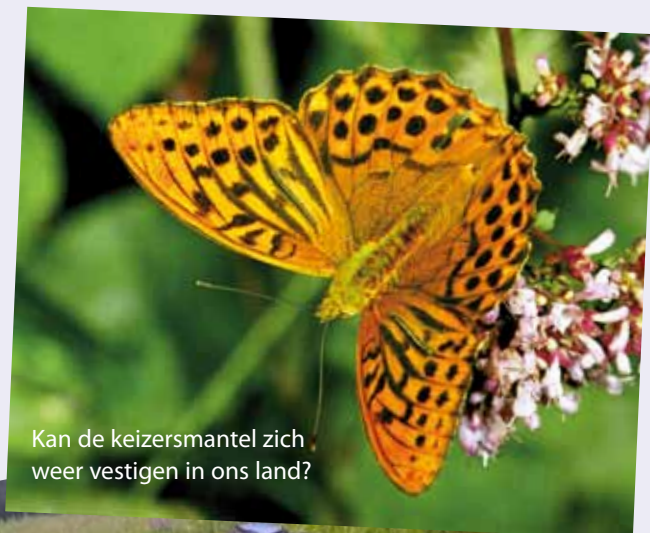
Kan de keizersmantel zich weer vestigen in ons land?