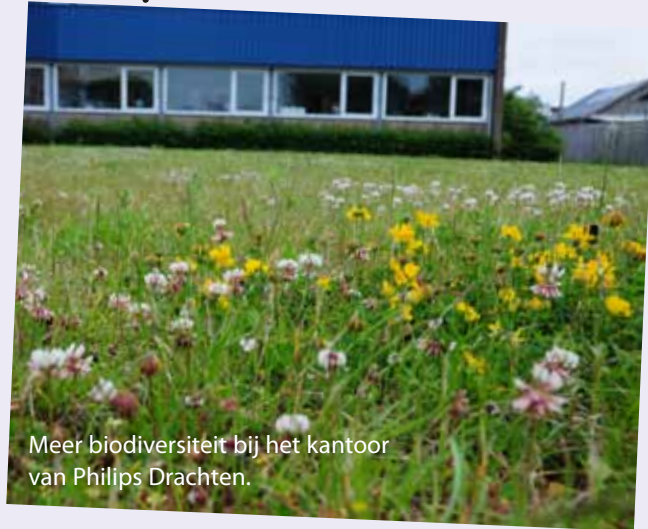
Meer biodiversiteit bij het kantoor van Philips Drachten.