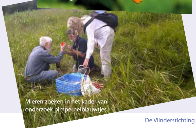
Mieren zoeken in het kader van onderzoek pimpernelblauwtjes.

Licht op natuur: onderzoek naar het effect van kunstlicht op nachtvinders.