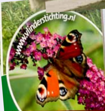
Bord op de Floriade.