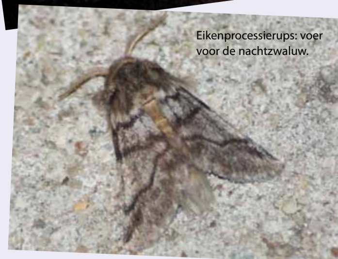
Eikenprocessierups: voer voor de nachtzwaluw.

Licht op natuur: onderzoek naar het effect van kunstlicht op nachtvinders.