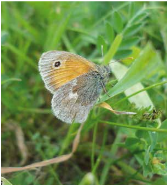
Beren van Duijn

Het is opmerkelijk dat een in Nederland algemeen voorkomende soort als het hooibeestje maar niet terugkeert. De vereiste habitat lijkt tegenwoordig meer dan ooit aanwezig. Een hoogwatervrije plekken maken herkolonisatie na hoogwater mogelijk. Ook liggen er natuur-