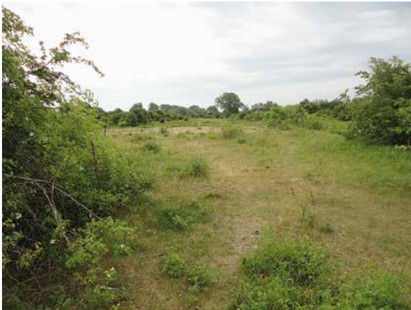
Beren van Duijn

De exacte uitzetlocaties zijn gekozen aan de hand van de aanwezigheid van zandig, kort grasland, nectarplanten en solitaire struiken. Dit is op de foto hierboven te zien. Zowel de Groenlanden als de Millingerwaard worden jaarrond extensief begraasd door wildlevende paarden en runderen. Eitjes, rupsen en poppen heb-