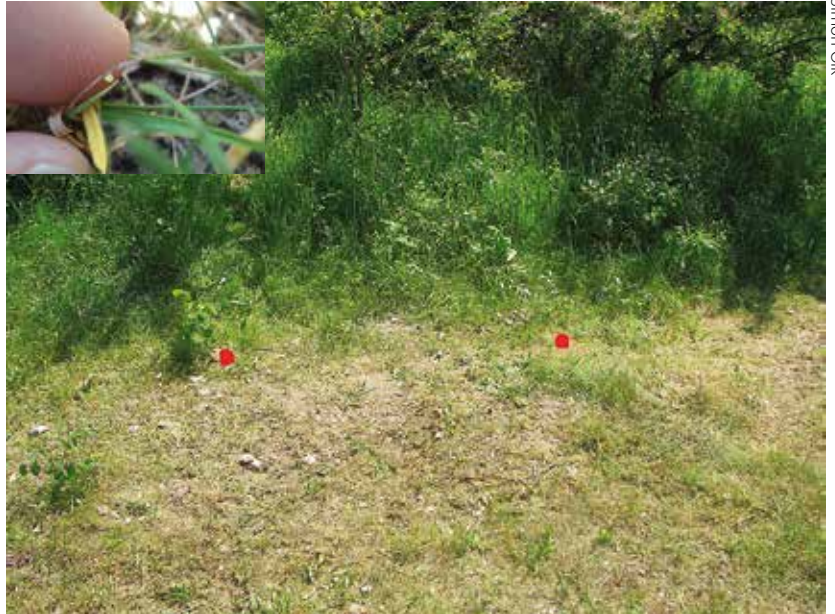
Twee plekken waar eiafzet heeft plaatsgevonden. Precies op de overgang tussen droog en vochtiger grasland. Inzet: het eitje van de rechter locatie.