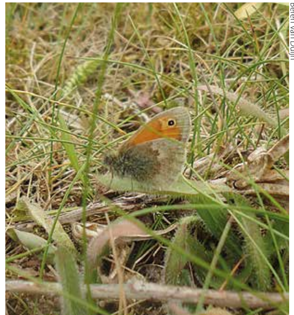
Beren van Duijn

Het hooibeestje is een kleine dagvlinder die meestal met de vleugels dicht in grazige vegetatie zit. De oranje kleur van de bovenkant van de vleugels valt bij het vliegen goed op.