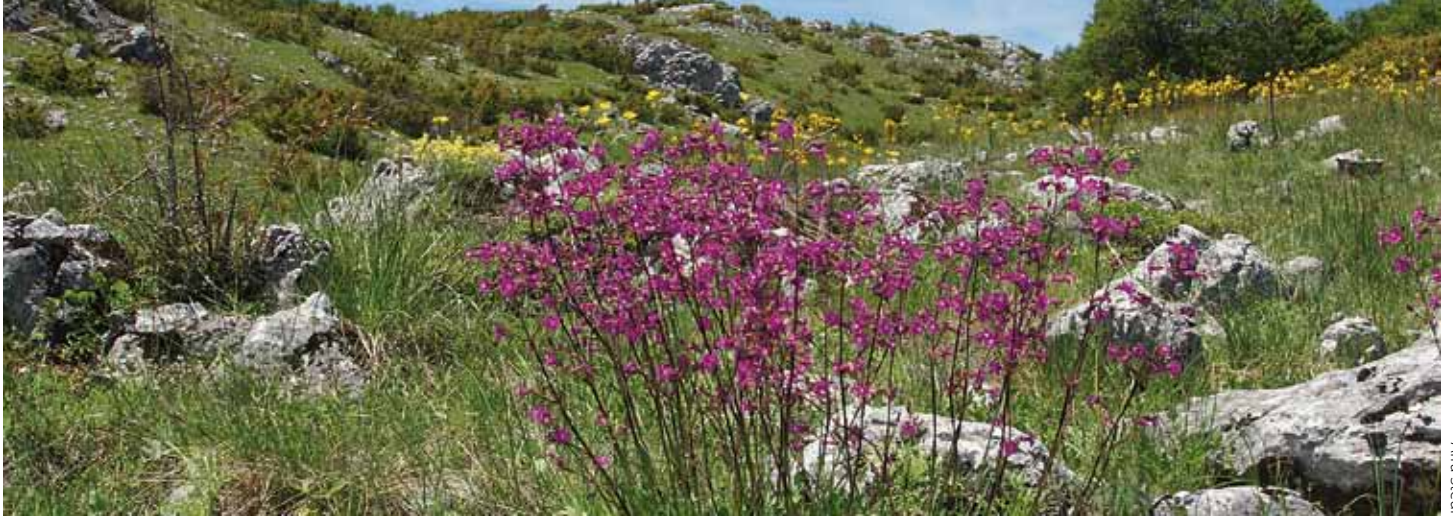
Bloemenpracht langs de Dva Jabori-trail