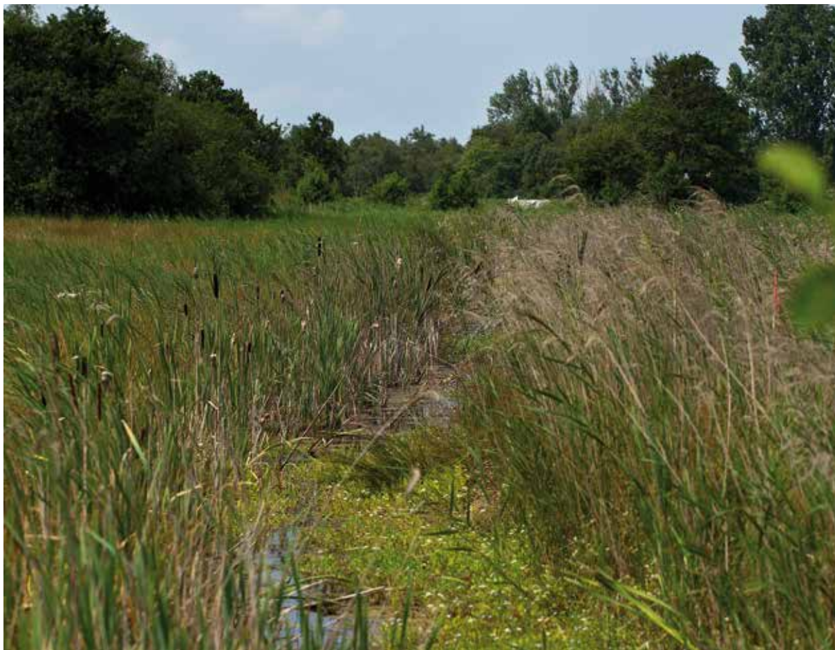
Biotoop van de grote vuurvlinder.

moerasbodems die bestaan uit plantenresten - verzuuren en geen geschikt milieu meer vormen voor riet, bieden zij ruimte aan waterzuringplanten om te groeien en voedsel voor de grote vuurvlinder.