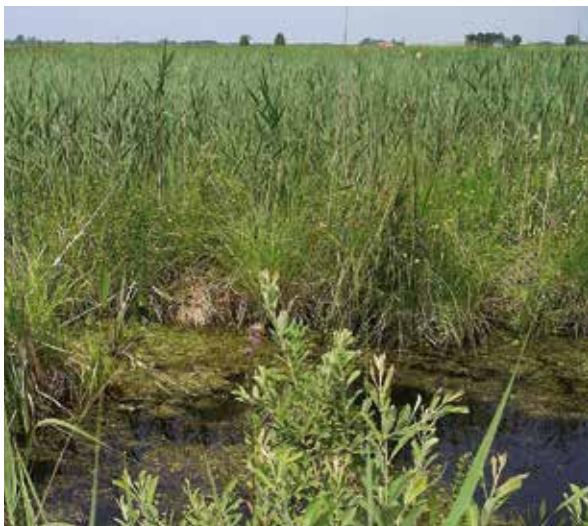
Henk de Vries

De grote vuurvlinder leeft in dit soort moerasige gebieden.