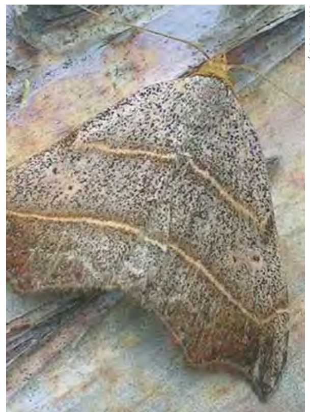
De zeldzame bruine sikkelluil ( Laspeyria flexula )