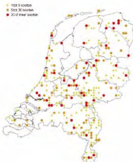
Figuur 1. De locaties waarvan waarnemingen zijn binnengekomen.