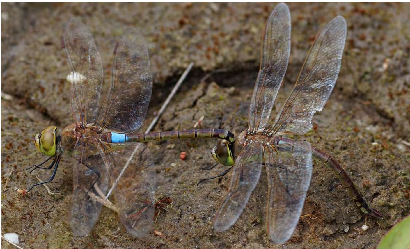
Zadellibellen hebben dit jaar veel eieren afgezet in Nederland

Op verschillende plekken zijn in Nederland zadellibellen opgedoken. Dit waren zwervers uit het zuidoosten. Ze zijn samen met de distelvlinders uit de omgeving van Israël gekomen. Tot nu toe waren er, als er al zadellibellen naar Nederland kwamen, altijd maar een paar, maar dit jaar waren het er tientallen. Bovendien waren ze vroeg en hebben ze op veel plekken eieren afgezet. Omdat ze zo vroeg waren, hebben de larven een groot deel van de zomer om te groeien en met de temperaturen die we hebben gehad moet dat wel lukken. Op diverse plekken zijn ook al larven gevonden en in Tsjechië en Saksen zijn de eerste uitsluiers van de nieuwe generatie al gezien. Het is dus te verwachten dat er binnenkort in Nederland ook zadellibellen uit zullen sluipen. Dat zou een unicum zijn, dat is nooit eerder in Nederland gebeurt.