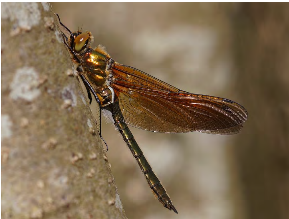
Libellen die duidelijk net uitgeslopen zijn, zoals deze smaragdlibel, worden niet geteld

een paar dagen eerder of later bent (zolang het weer goed is). Maar je kunt soms grote aantallen uitsluipers hebben en twee dagen later vrijwel geen. Het ene jaar tel je toevallig wel op een dag met veel uitsluipers en het jaar daarna toevallig niet. Als je de uitsluipers dan ook telt lijkt het of er het eerste jaar een veel grotere populatie is dan het tweede jaar, wat natuurlijk niet terecht is. Daarom tellen uitsluipers niet mee op de routes, ook al zijn ze zo belangrijk.