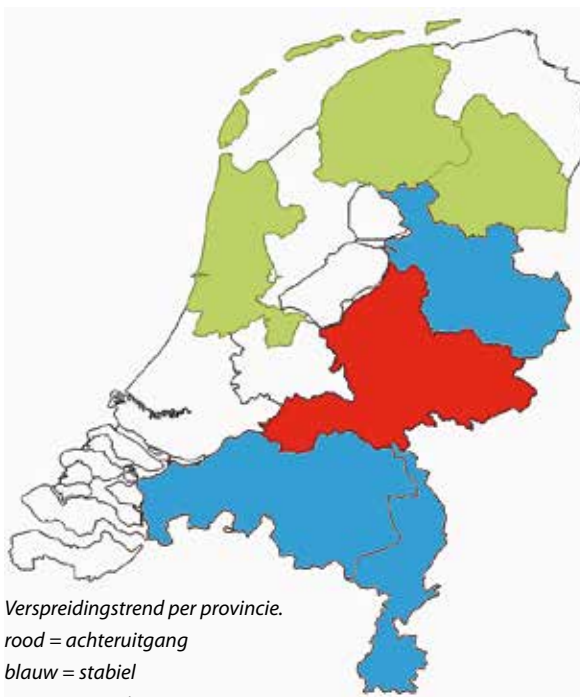
Verspreidingstrend per provincie.