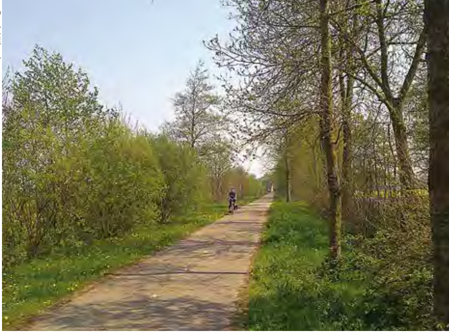
Het fietspad langs de Vlinderberm.

Zeker na de eeuwwisseling heeft de Wielenwerkgroep