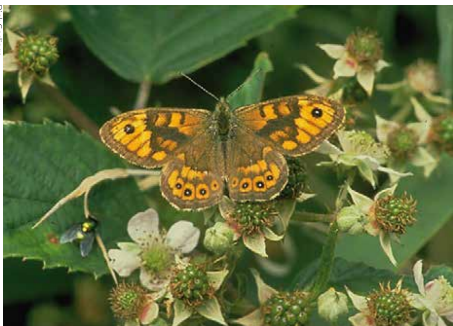
In de Vlinderberm heeft de argusvlinder zich tot 2003 goed gehandhaafd. Sinds 2010 lijkt hij echter hieruit te gaan verdwijnen.