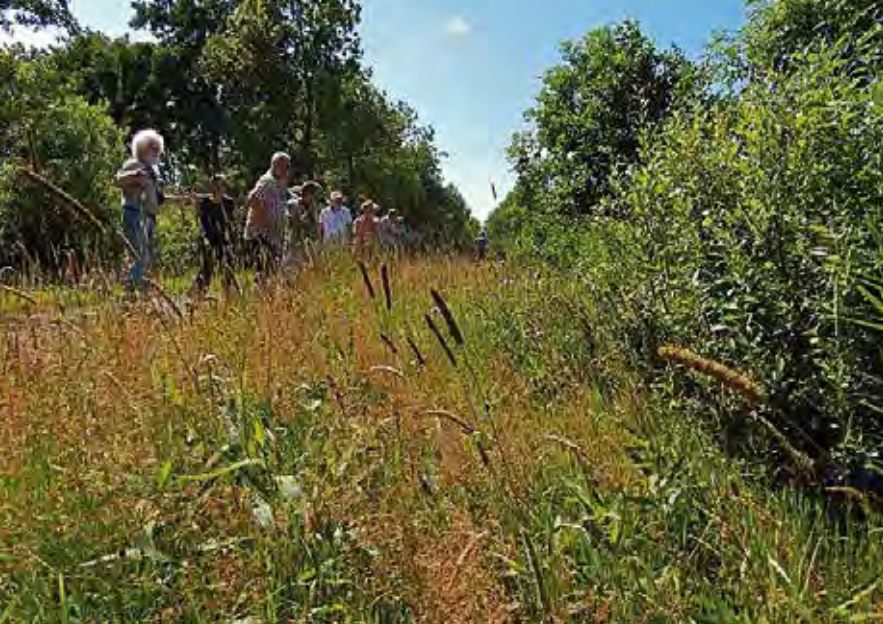
Excursie bij de presentatie van het rapport over de Vlinderberm op 19 juli 2013.

gekeerd, verzameld en afgevoerd. Dit vindt plaats aan de noordzijde van de berm langs de sloot. Doordat het maaisel enige dagen blijft liggen en pas daarna wordt verzameld en opgehaald, kan een deel van de aanwezige zaden en vlinderpoppen in de berm achterblijven. Door maaien en afvoeren wordt de vegetatie schraler en minder hoog en wordt de berm bloemrijker. Op den duur hoeft er mogelijk nog maar eenmaal per jaar gemaaid te worden. De berm moet echter niet té schraal worden, want dan gaat de bloemrijkheid weer achteruit. Enkele bloemrijke plekken met knooppkruid en een plek met grasklokje worden bij de juni-maaibeurt ontzien. In 2013 zijn ook enkele andere plekken met veel nectarplanten bij de september-maaibeurt overgeslagen, om de zaadval te bevorderen.