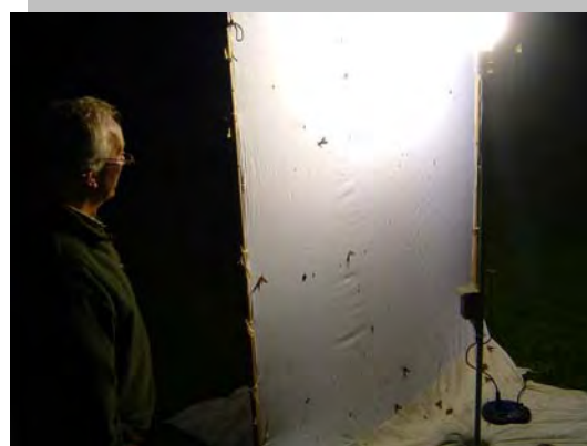
Licht trekt niet alleen vlinders maar ook mensen.