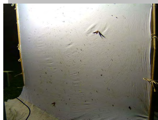
De eerste pijlstaarten zijn er al