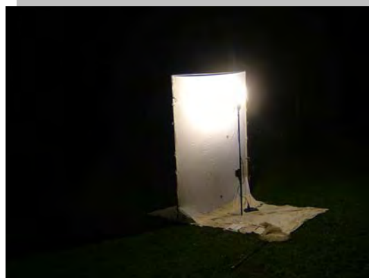
Laken, nachtvlinderopstelling, lamp 400watt HPL