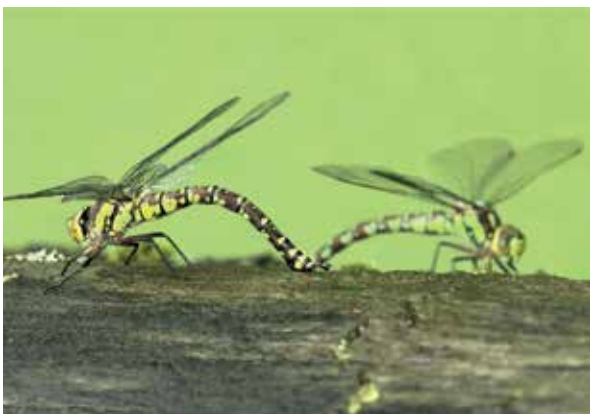
Afb. 10: Twee vrouwjes; het linker is geler dan het rechter.

Geslachtsrijpe vrouwjes beperken het afzetten van eitjes niet tot de locatie waar ze zelf zijn uitgeslopen. Door hun grote actieradius – meerdere kilometers – kunnen ze andere geschikte vijvers koloniseren. Ook komen (sommige) vrouwjes op herhaling wanneer ze tijdens de eileg zijn verstoord en verjaagd en