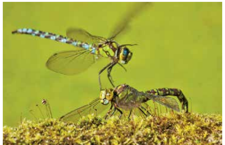
Afb. 4: Vrouwtje in normale legstand (links) en tijdens de weiger-houding (rechts).