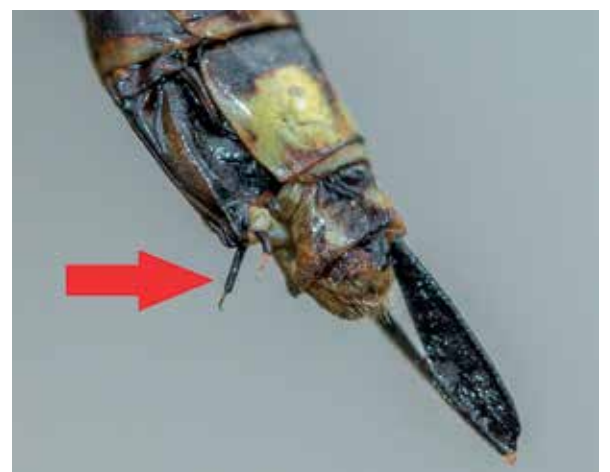
Afb. 7: Tast-orgaantjes – styli – onderaan het achterlijf.