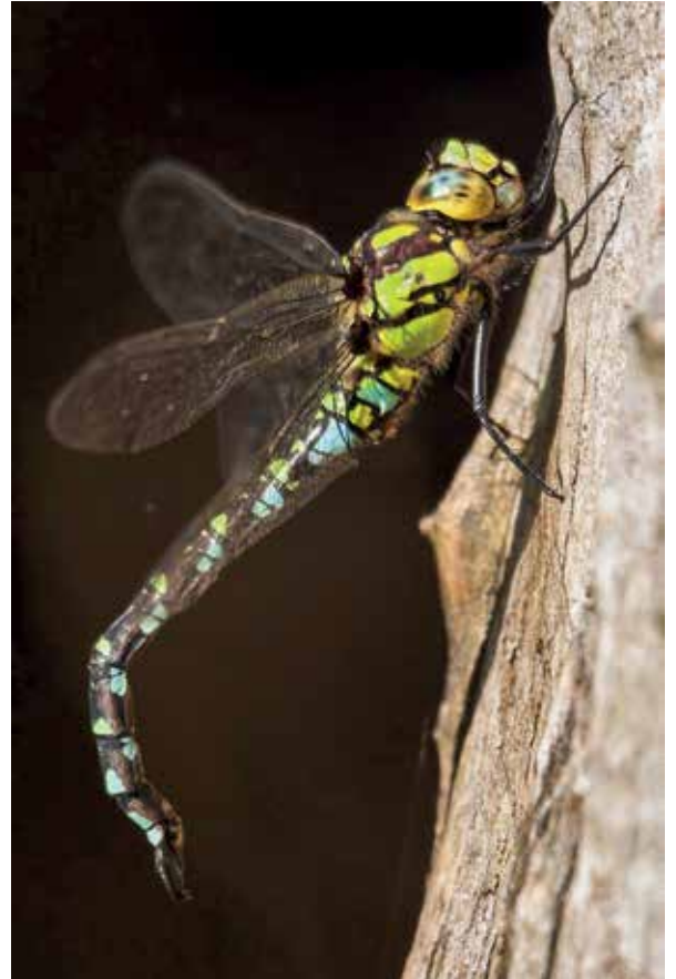
Afb. 6: Mannetje rustend na paring met achterlijf nog in de copulatiestand.

a) Als ze niet paringsbereid is en genoeg houvast heeft, blijft ze liggen waar ze ligt en kan hij aan haar rukken en trekken wat hij wil. Als hij haar toch weet los te rukken, leidt dat zelden tot een paring, want met onwillige glazenmaaksters is het slecht ramen lappen.