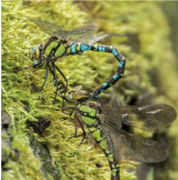
Afb. 5: Mannetje heeft vrouwkje in de nekklem en pauzeert tussen twee pogingen haar los te trekken.

3. ze laat zich verrassen, hij slaat zijn poten om haar rug en brengt razendsnel zijn aanhangsels als een nekklem in haar achterhoofd (afb. 5).