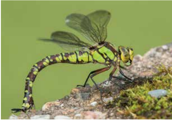
Afb. 8: Vrouwkje polst de betonrand op zijn hoedanigheid.

ze een geschikte plek op de oever. Ook al is die hier van beton, toch zal ze hem eerst testen (afb. 8). Soms treft ze het als er wat mos groeit. Zo niet, dan moet ze op zoek naar een alternatief. Dood hout van afgebroken takken in het bad blijkt vaak in trek, vooral als het bemost is. Het meest gebruikt wordt echter de middenin liggende populier die na 15 jaar op veel plekken behoorlijk rot is en aan de westzijde vrijwel continu vochtig en bemost is. Deze boom is daardoor een surrogaatoever geworden. Op hoogtijdagen zitten er vaak meerdere vrouwjes bij elkaar (afb. 9 en 10). Niet-verstoorde eileg kan meer dan een uur duren waarbij circa 1000 eitjes worden gelegd.