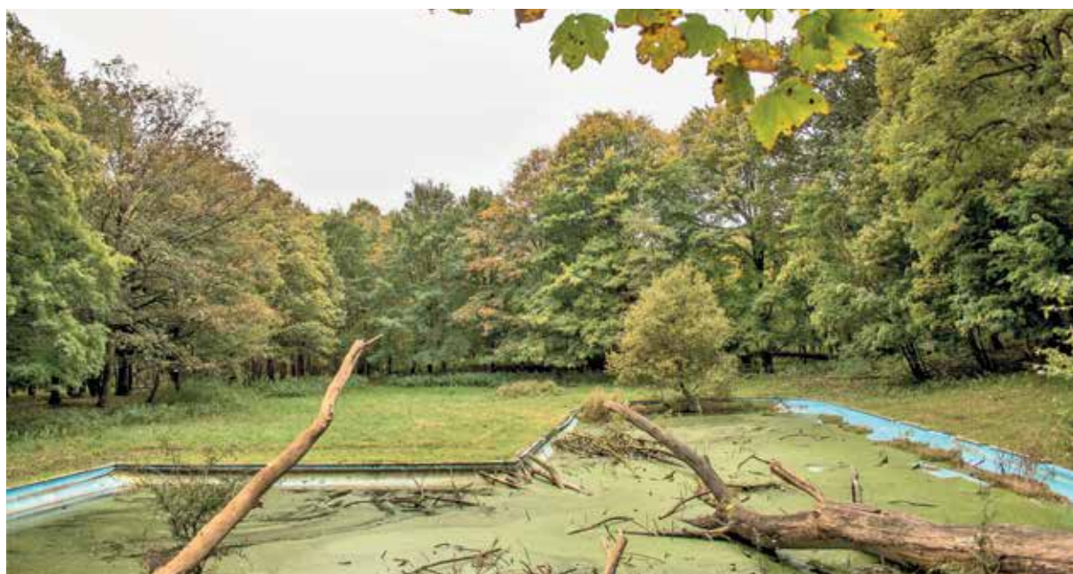
Afb. 1: Het zwembad gezien vanuit het noorden.