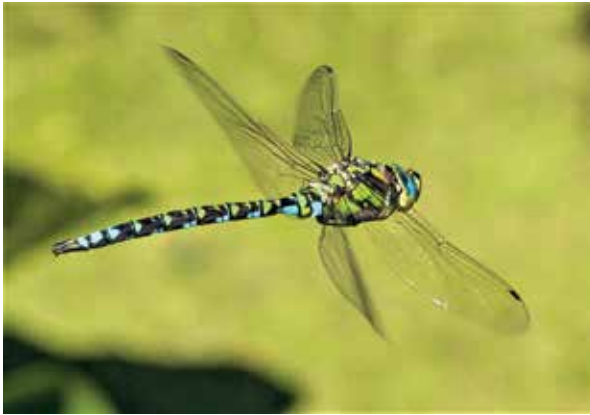
Afb. 3: Patrouillerend mannetje.