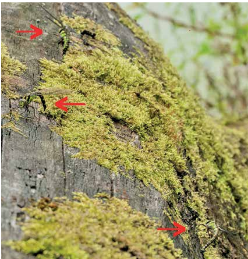
Afb. 9: Drie vrouwpjes vlak bij elkaar ei-afzettend

Na de paring kan ze al na een minuut of tien overgaan tot eileg. Een vrouwkje bepaalt niet op het zicht de geschiktheid van het substraat. Twee stiftvormige tastorganen aan het eind van haar onderlijf peilen de kwaliteit van de ondergrond (afb. 7). Instinctief zoekt