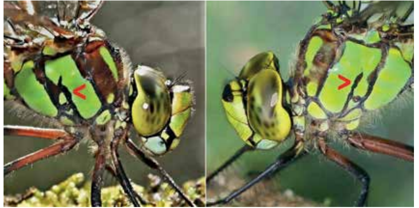
Afb. 11: Verschillen in streping op het borststuk.

wanneer ze bij de eileg opnieuw door een mannetje zijn gegrepen en bevrucht. Dat er sprake is van herhaling kan geconstateerd worden op basis van foto's. Ieder individu heeft z'n eigen karakteristieke streping op de zijkant van het borststuk. Zoals de foto van afbeelding 11 aantoont, kunnen die twee parallel lopen of met elkaar verbonden zijn en smal of breed zijn. Deze zijn de twee uiterste varianten. Gedurende het voortplantingsseizoen lopen libellen bij hun foerageertochten in de wijde omgeving soms beschadigingen op; ze vliegen tegen ruiten in hun jacht op insecten of komen in aanraking met takken. Deze botsingen veroorzaken 'blauwe plekken' van diverse grootte en vorm. Ze blijven de libel de rest van z'n bestaan ontsieren (afb. 12).