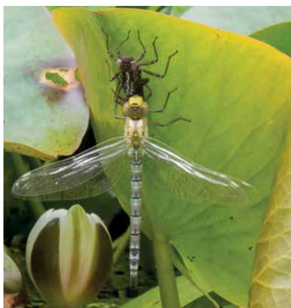
Afb. 2: Vrouwtje kort voor de maidenflight.

Als zomersoort sluipt de blauwe glazenmaker relatief laat uit, meestal pas in de laatste week van mei. Met de dag neemt het aantal toe en de top ligt in de laatste week van juni en de eerste week van juli. Soms sluipen er in een paar ochtenduren meer dan dertig exemplaren uit. Na ongeveer drie uur kiest de libel het luchtruim, de maidenflight (afb. 2). Ze is dan nog een stuntelig prototype van de latere stuntvlieger. Vrijwel loodrecht fladdert ze omhoog naar een boomkruin om daar uit te harden.