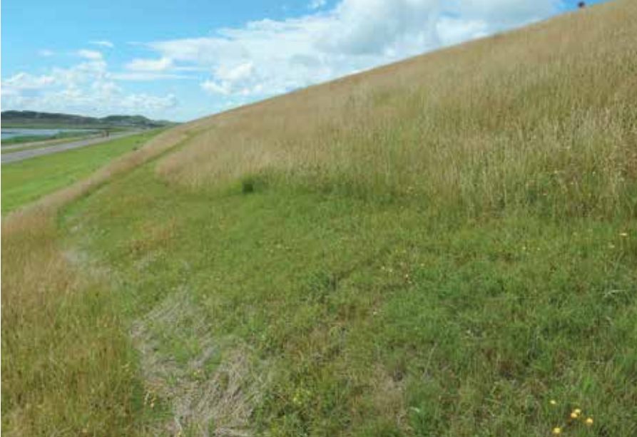
Op het schuine talud van de Hondsbossche Zeewering is een sinuspad maaien geen sinecure, maar de aannemer gaat geen uitdaging uit de weg.