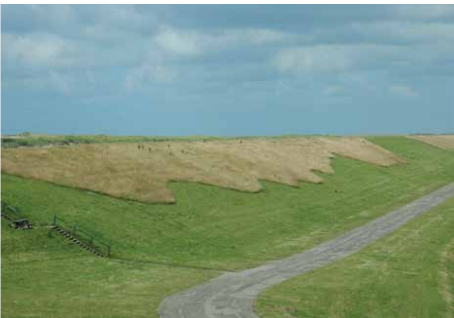
Sinusbeheer inspireert de aannemer om anders te maaien. Geen sinusbeheer avant la lettre, maar er blijft wel veel vegetatie per maaibeurt staan.