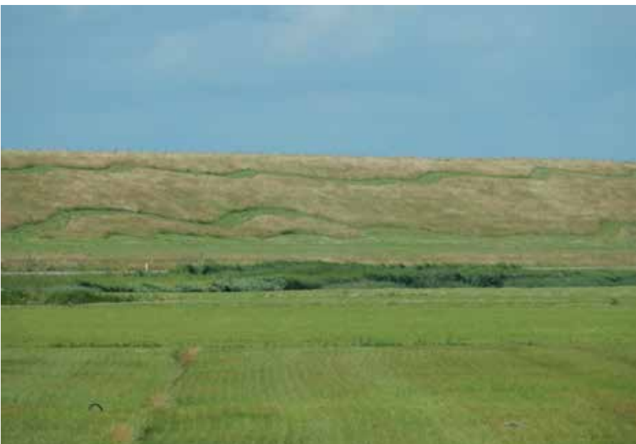
Vanuit de polder is het slingerende sinuspad op de dijk al zichtbaar.