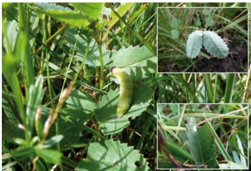
Aardbeivlinderrups op grote pimpernel. Er zijn zowel vraatsporen aanwezig (onderste inzetfoto) op deze plant als spinselnesten (bovenste inzetfoto).

Dat de aardbeivlinder wel degelijk nieuw leefgebied kan koloniseren, is ook vastgesteld in het eerder genoemde natuurontwikkelingsterrein: het gehele terrein is hier gekoloniseerd door de soort. Maar hij is in het voorjaar van 2012 ook buiten dit natuurontwikkelingsterrein, in de Olde Maten waargenomen. Het betrof drie exemplaren die minstens 130 meter afgelegd moeten hebben door ongeschikt leefgebied en tevens een breed kanaal en aanliggende weg hebben moeten