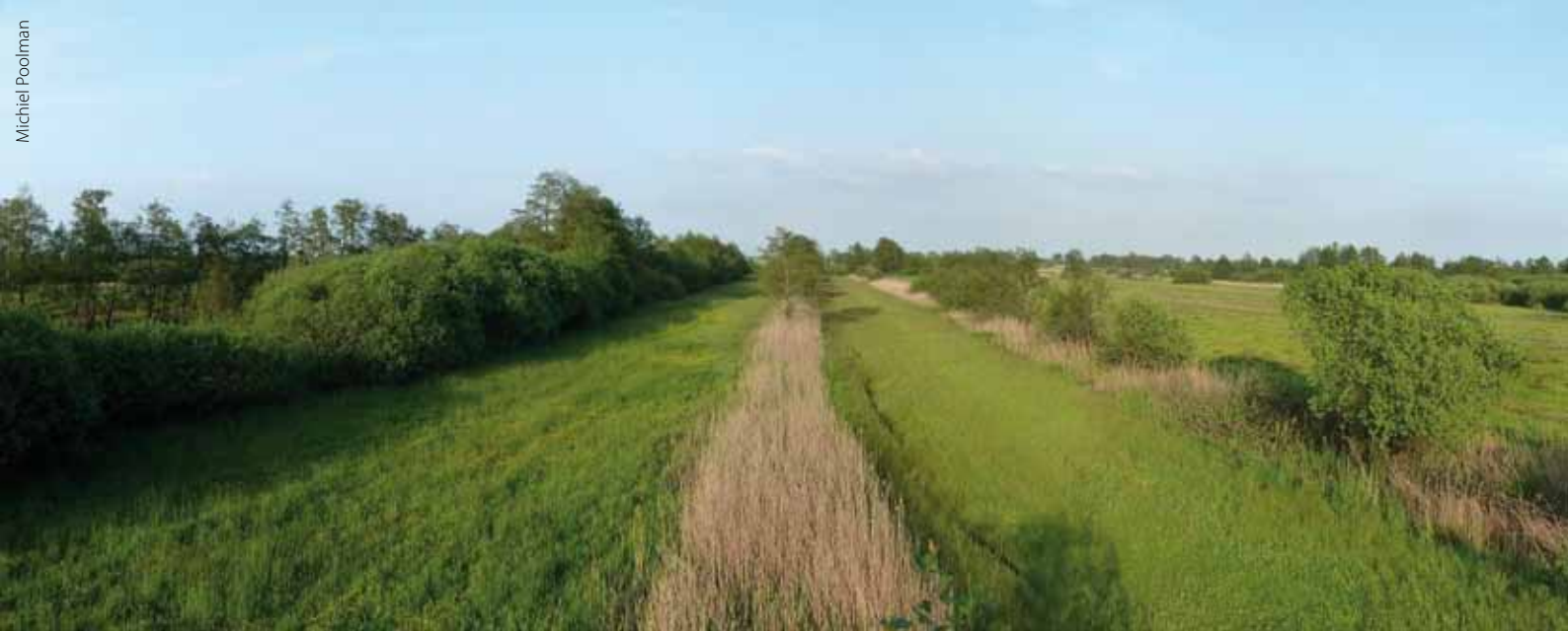
Panorama van het leefgebied van de aardbeivlinder in het karakteristieke slagenlandschap van de Olde Maten.

tal toe (figuur 1). In 2009 is de soort voor het eerst vastgesteld in het naastgelegen natuurontwikkelingsterrein (zie overzichtskaart). Hier heeft in 1997 maaiveldverlaging plaatsgevonden door het verwijderen van de voedselrijke bovengrond met als doel blauwgrasland te realiseren. In overleg met De Vlinderstichting is hier in 2010 een soortgerichte vlinderroute uitgezet, gericht op de aardbeivlinder. Opvallend is dat de zilveren maan dit terrein (op een enkele losse waarneming na) nog niet gekoloniseerd heeft, terwijl hij wel veelvuldig voorkomt in het blauwgraslandreservaat.