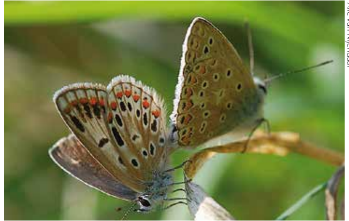
Alle van Nijendaal