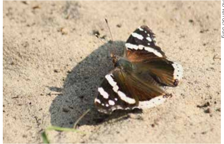
Ab van der Burg