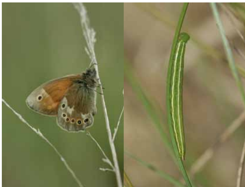
Veenhooibeestje (vlinder en rups).

De mannetjes zijn vaak wat kleiner en donkerder dan de vrouwtjes. De vrouwtjes lijken dus het grootste te zijn en maken een meer oranje indruk. De binnenkant