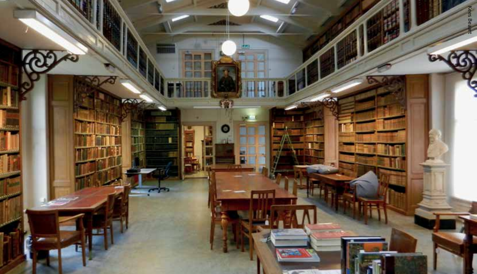
Interieur Artis Bibliotheek. Zowel het gebouw uit 1868, de collectie en het interieur van de bibliotheek zijn van historisch belang.

ving der Dieren, Planten en Mineralen, Volgens het Samenstel van den Heer Linnaeus. Met naauwkeurige Afbeeldingen.” Tussen 1761 en 1773 verscheen dit werk in 37 delen. De insecten, waaronder toen ook nog o.a. spinnen, mijten en kreeftachtigen werden gerekend, worden in vijf delen behandeld. De vlinders worden besproken in het ‘EERSTE DEELS, ELFDE STUK. Ver- volg der insecten.’ dat uitkwam in 1767, hetzelfde jaar waarin ook de twaalfde uitgave van Systema Naturae verscheen.