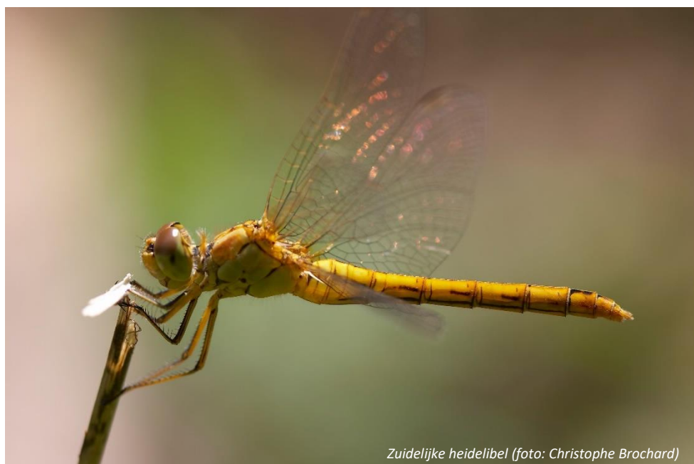
Zuidelijke heidelibel

Door de opwarming van het klimaat komen er steeds meer zuidelijke soorten ons land binnen. In 2019 was de zadellibel daar een sprekend voorbeeld van. Deze Afrikaanse soort bereikte massaal ons land en heeft er zich zelfs voortgeplant. De soort kan echter onze winters niet overleven, dus blijven we afhankelijk van invasies. Andere zuidelijke soorten hebben inmiddels wel populaties in Nederland en breiden zich steeds meer. Dat gold al geruime tijd voor de vuurlibel en de zuidelijke keizerlibel. Inmiddels zijn ook gaffelwaterjuffer, zuidelijke glazenmaker en zuidelijke heidelibel in een steeds groter deel van Nederland te vinden. Wees dus alert op deze soorten, ze zouden zomaar op je route kunnen opduiken!