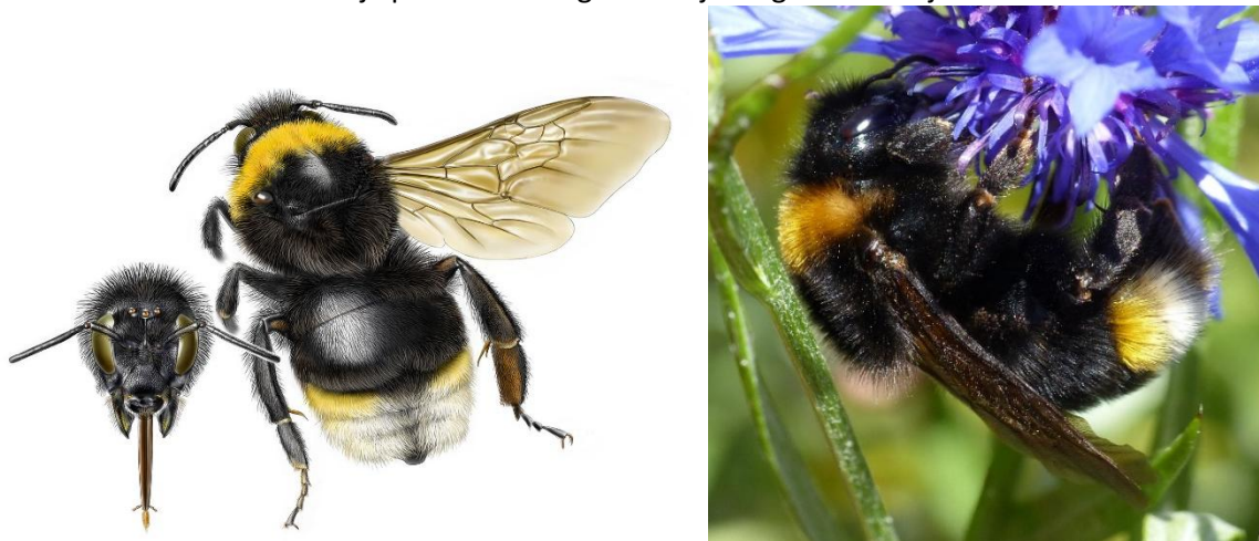
Vrouwtje grote/tweekleurige koekoekshommel. Tekening: Jeroen de Rond.

De grote en tweekleurige koekoekshommel lijken sterk op elkaar en daarom kun je deze als verzamelsoort invoeren. Beide soorten hebben een witte kont en een gele kraag. Het belangrijkste kenmerk is de witte achterlijfspunt met een geel randje langs de voorzijde.