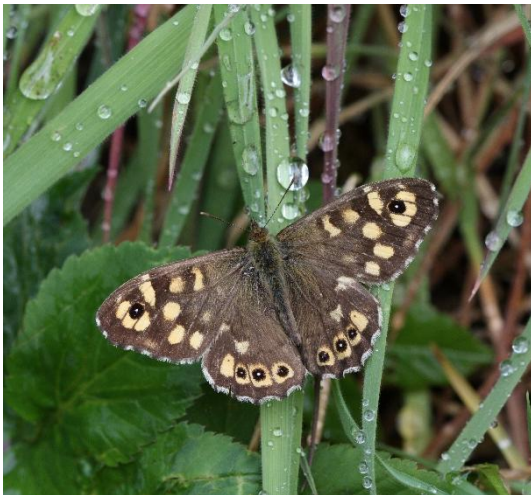
Gemiddeld aantal dagvlinders in meetnet vlinders

Uit het gemiddeld aantal dagvlinders dat geteld is binnen het NEM-meetnet dagvlinders in 2026, is goed te zien dat de afgelopen weken wat wisselvallig zijn geweest wat betreft de temperatuur en zonneschijn. Midden maart hebben we goeie vlinderdagen gehad, terwijl het de afgelopen twee weken veel afwisselender koud en nat waren. Het aantal vlinders dat zich laat zien reageert hier direct op, zoals te zien is aan het piekje rond midden maart. Zoals altijd zijn de vlinders die als imago overwinteren als eerste te zien, maar ondertussen zijn ook de eerste pop-overwinteraars aan het vliegen, zoals het klein koolwitje, het klein geaderd witje, het boomblauwtje, de grote en de kleine vos, het oranjetipje en het bont zandoogje.