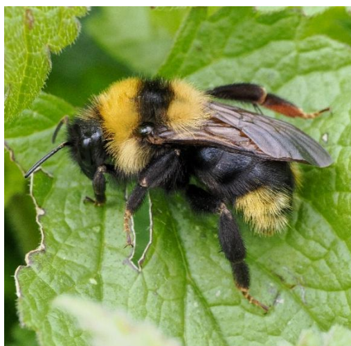
Vrouwtje gewone koekoekshommel. Tekening: Jeroen de Rond.