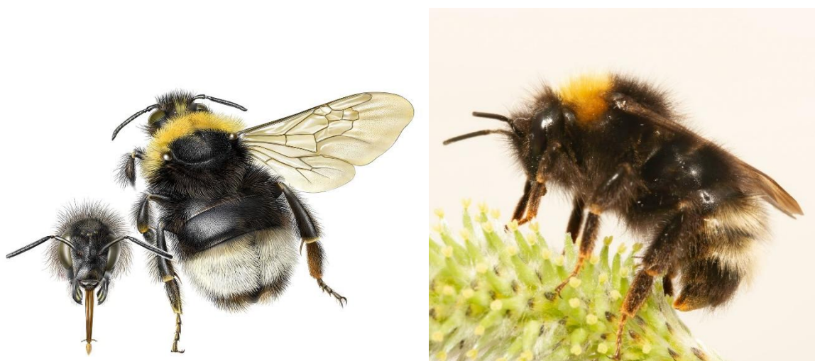
Vrouwtje vierkleurige/boomkoekoekshommel. Let rechts op de achterlijfspunt die richting de buik gekromd is. Tekening: Jeroen de Rond.

De vierkleurige en de boomkoekoekshommel zijn in het veld helaas niet te onderscheiden en moeten daarom altijd als verzamelsoort ingevoerd worden. Dit soortenpaar is te herkennen aan de witte achterlijfspunt (witkont) in combinatie met gele kraag. In tegenstelling tot het soortpaar grote/tweekleurige koekoekshommel heeft de vierkleurige/boomkoekoekshommel géén geel op het achterlijf. Belangrijk is ook om naar de achterlijfspunt te kijken: die krult op richting de buik. Ook voor dit soortpaar is het belangrijk om foto's te maken. Er kan namelijk verwarring optreden met de grote/tweekleurige koekoekshommel. Maak daarom altijd een foto van de hommel in haar geheel (liefst van zijkant en bovenkant) en van de achterlijfspunt van de zijkant gezien.