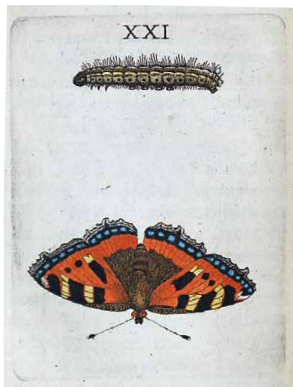
Gulsigaert/kleine vos: door Goedaert vervaardigde en ingekleurde ets.