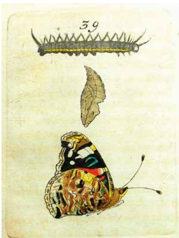
Klok-luyer/atalanta: ets en inkleuring door Goedaert.