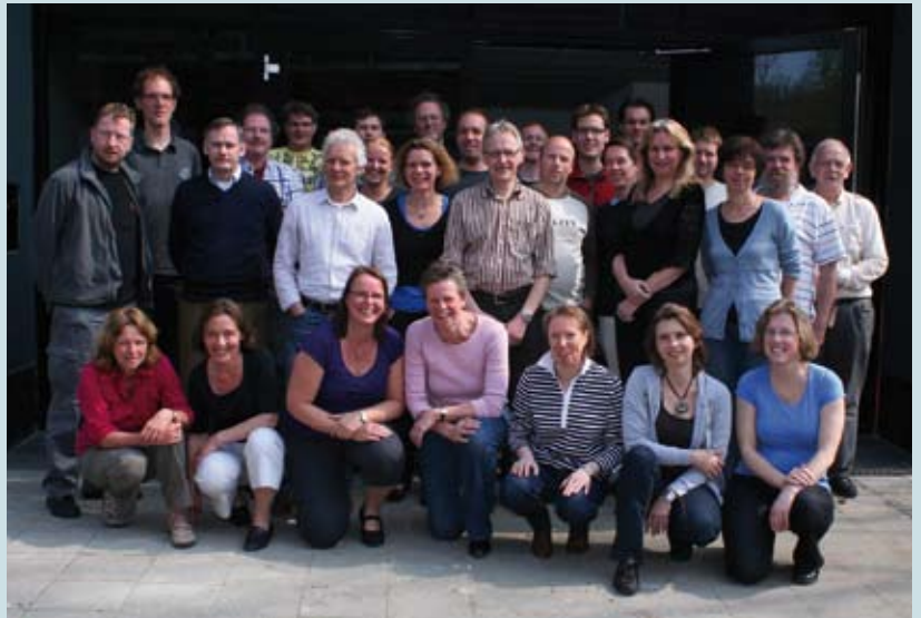
De medewerkers van De Vlinderstichting. Per 1 januari waren bij De Vlinderstichting dertig mensen in vaste dienst en werkten er vier met een tijdelijk contract. Op het kantoor van De Vlinderstichting draagt ook een tiental vrijwilligers nog een steentje bij.

Over onze jubileumactiviteiten hebt u het afgelopen jaar al veel kunnen lezen. De feestelijke Landelijke Dag, Het vlindercongres en het libellensymposium, de waarnemersdag, de vlinderestafette langs het Pieterpad, de speciale nachtvlindernacht, fotopuzzelmiddag en fotowedstrijd: samen met onze aanwezigheid bij vele markten en beurzen zorgden deze evenementen voor veel publiciteit en naamsbekendheid. Daarnaast verschenen er enkele boeken en een speciale editie van Vlinders (zie kader).