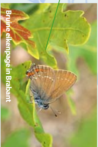
Bruine eikenpage in Brabant

Om te komen tot een effectieve bescherming van de bruine eikenpage in Noord-Brabant is het noodzakelijk de redenen van de recente achteruitgang te achterhalen. Met de steun van provincie Noord-Brabant is dit onderzoek, zijn prioritaire gebieden aangegeven en zijn concrete maatregelen geformuleerd voor het behoud en herstel voor deze soort.