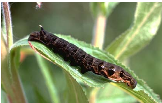
Figuur 1. Avondroodrups

Je kunt ook 's nachts gaan zoeken. Veel rupsen zijn namelijk 's nachts actief. Je vindt ze met behulp van een zaklantaarn.