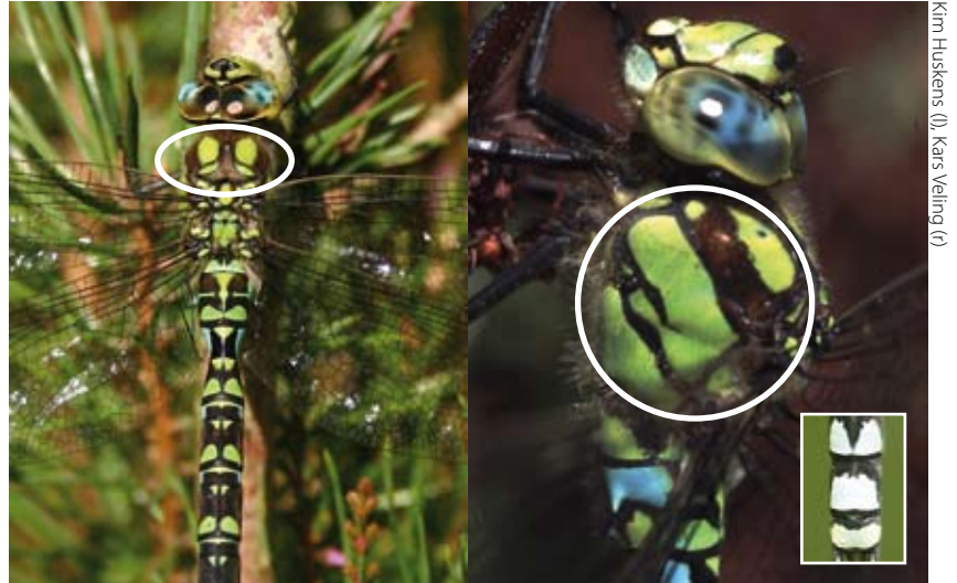
De blauwe glazenmaker heeft grote ovale schouderplekken; veel groen op de zijkant van het borststuk en een 'lantaarntje' aan het achterlijf.

Blauwe glazenmakers zijn zeer algemeen bij voedselrijke plassen en tuinvijvers. Ze vliegen in een rustig tempo laag boven de grond, meestal in de schaduw. Ze zoeken hun omgeving minutieus af en komen daarbij vaak opvallend dicht in de buurt van mensen en bebouwing. Door dit gedrag komen blauwe glazenmakers nogal eens binnenhuis achter het vensterglas terecht, of ze worden gevangen door huiskatten.