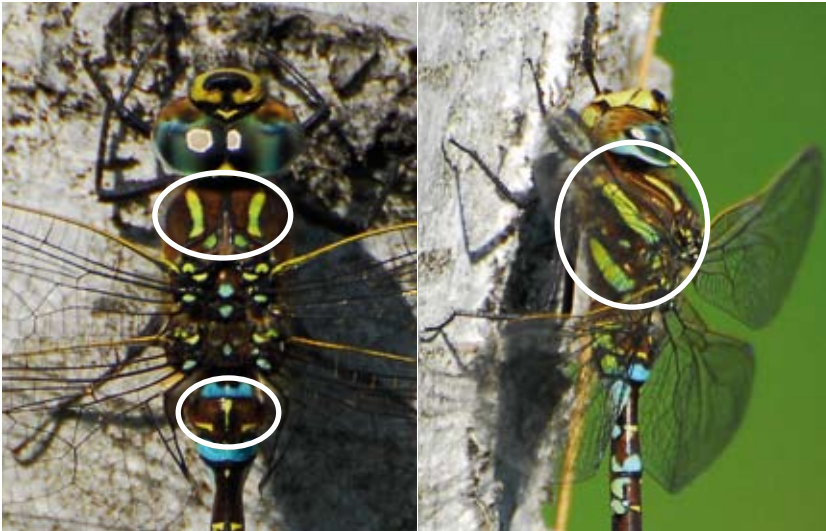
De veenglazenmaker heeft lange gele schouderstrepen en een smal geel streepje; twee gele banden op het borststuk.