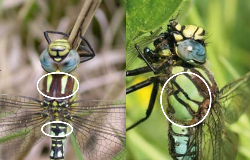
De glassnijder heeft goedontwikkelde schouderstrepen en geen geel spijkertje of lengtestreepje; veel groen op de zijkant van het borststuk. Let ook op de subtiele donzige beharing.