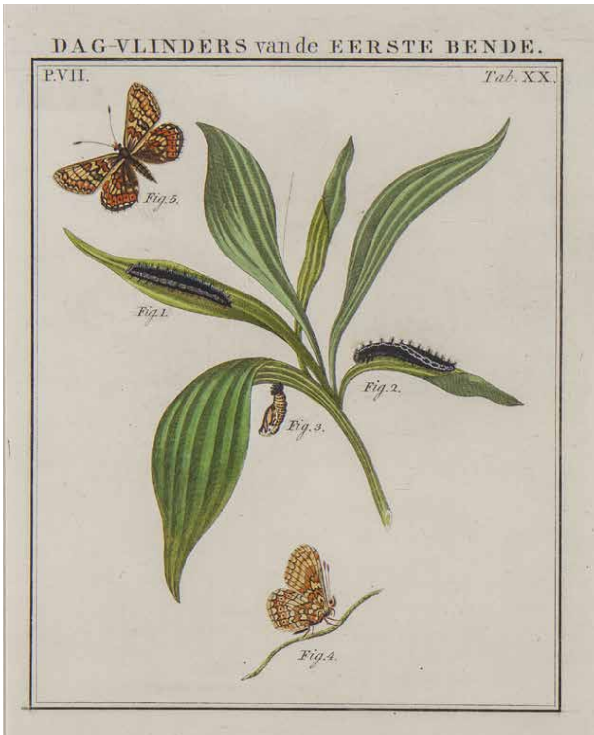
Moerasporelmoervlinder op smalle weegbree, getekend door Jan Sepp.