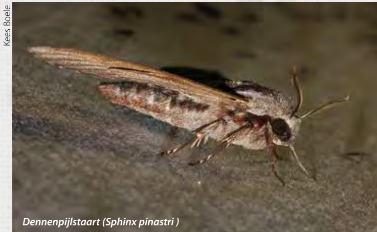
Dennenpijlstaart ( Sphinx pinastri )