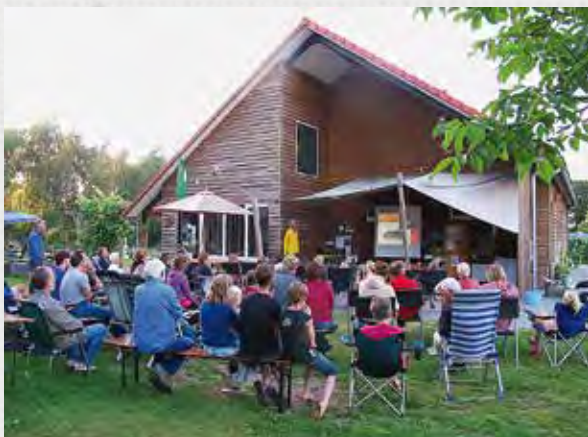
Lezing voorafgaand aan het nachtvlinders.

en-zoutvlinder ( Biston betularia ) / blauwooggrasmot ( Agriphila straminella , beide 25). Iedereen vraagt altijd naar de meest bijzondere vlinder. Was dat nu de tweestreepgrasuil ( Mythimna turca ) die als zuidelijke soort voor het eerst de Overijsselse Reest bereikte op Landgoed Vilsteren? Of was het de tweekleurige tandvlinder ( Leucodonta bicoloria ) op dezelfde plek? De witvlekbosrankspanner ( Melanthia procellata ) in Vaals? De brummelspanner ( Mesoleuca albicillata ) in Buurse? Of toch die drie paddenstoeluiltjes ( Parascotia fuliginaria ) in Boyl, Sellingen en Nederhemert-Zuid? De complete soortenlijst van alle 39 locaties is te groot voor dit artikel. U kunt hem vinden rechts op de startpagina van www.nachtvlindersnacht.nl .