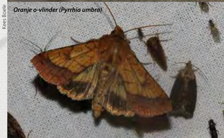
Oranje o-vlinder ( Pyrrhia umbra )