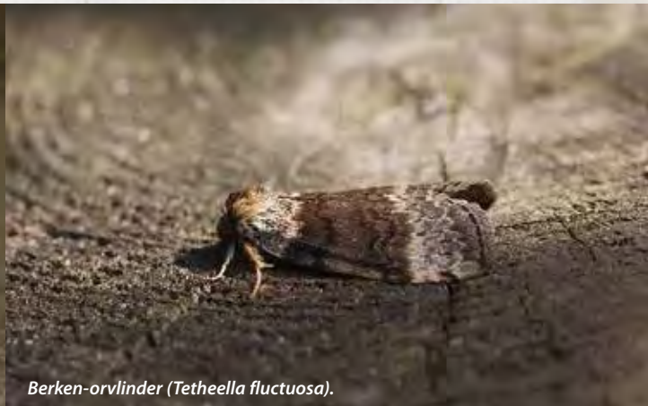
Berken-orvlinder ( Tetheella fluctuosa ).