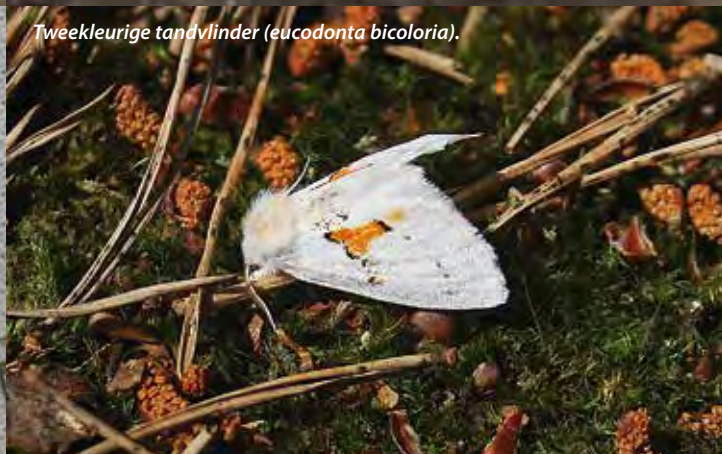
Tweekleurige tandvlinder ( eucodonta bicoloria ).

Er werden maar liefst 406 soorten genoteerd tijdens de 42 nachten op de 39 locaties.