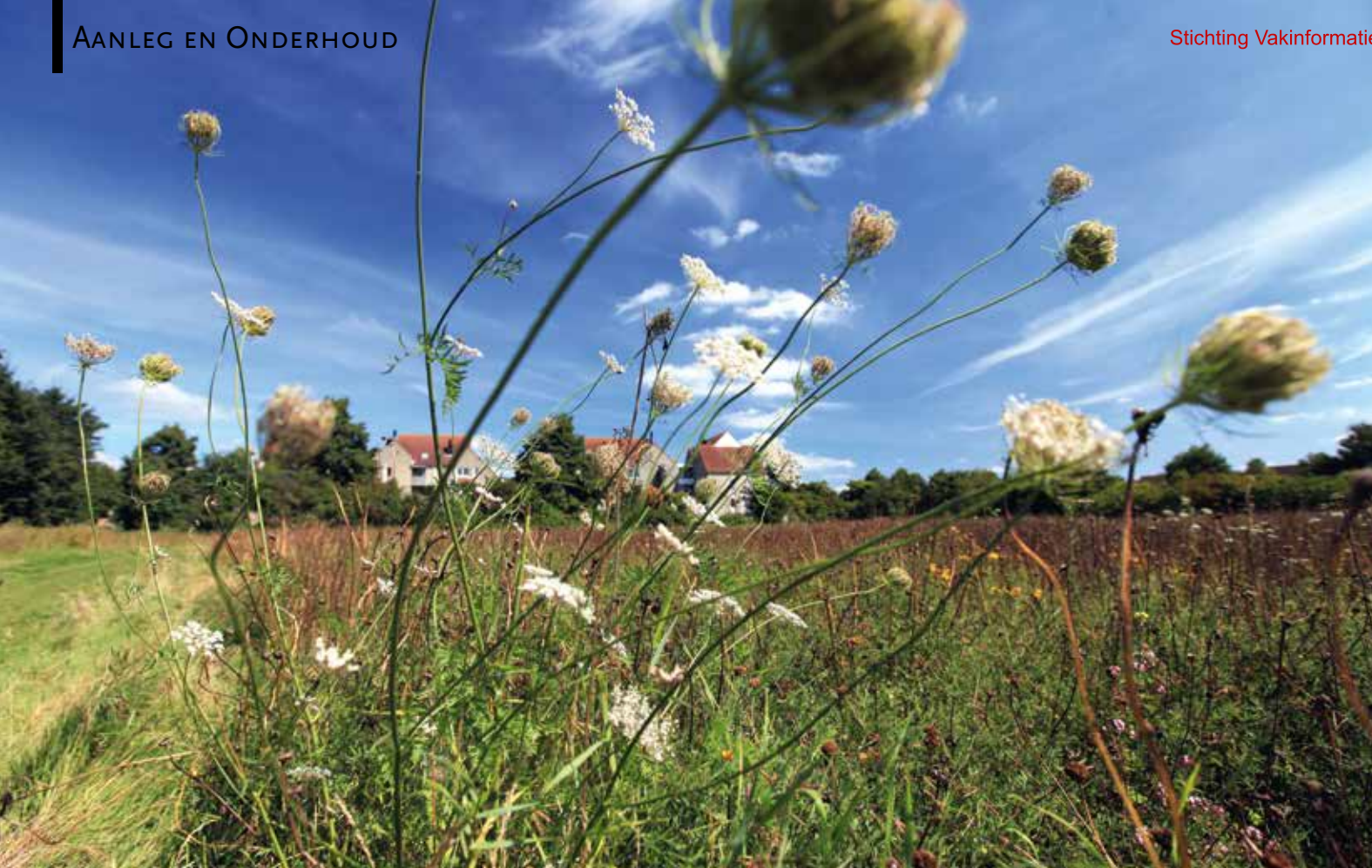
De vlinderidylle van Brielle is aangelegd op een voormalig sportveld in de wijk Nieuwland.