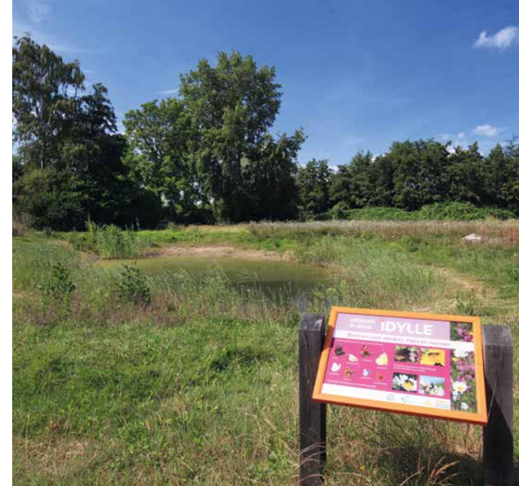
Bij elke idylle wordt een bord geplaatst met informatie over veelvoorkomende vlinders.

Het liefst wilde De Vlinderstichting ook dat de idylle minimaal vijf jaar zou kunnen blijven bestaan. Hierop heeft ze echter in een aantal gevallen een uitzondering gemaakt. „Omdat we ook tijdelijke natuur willen promoten, want dat is nog altijd beter dan de grond braak laten liggen.” Daardoor kan het dat 2 van de 54 idylles alweer zijn bebouwd.