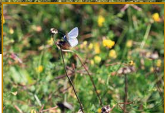
De vlinderidylles zijn bedoeld voor graslandvlinders zoals dit icarusblauwtje.