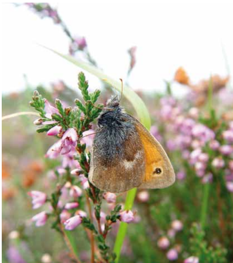
Hooibeestje op de hei.

Het Landelijk Meetnet Vlinders is een samenwerkingsproject van De Vlinderstichting en het CBS, in het kader van het Netwerk Ecologische Monitoring (NEM), in opdracht van EL&I. Dankzij dit meetnet kunnen we de ontwikkelingen in de vlinderstand nauwgezet volgen. Alle hulp en medewerking is welkom. Wilt u meedoen, dan kunt u zich aanmelden bij De Vlinderstichting.