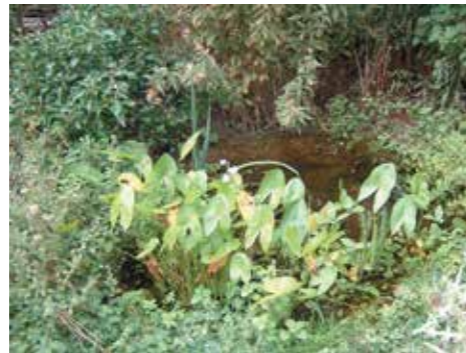
Libellen leven graag in vijvers met veel verschillende waterplanten.

Libellen kunnen in elke vijver leven, zolang er maar geen vissen in zitten. Ook zijn veel