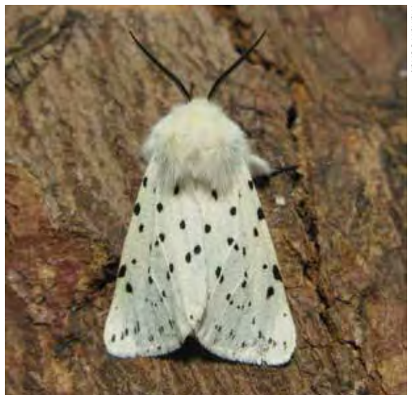
Witte tijger ( Spilosoma lubricipeda ).

In het nachtvlindermeetnet gaat het om monitoring. Hiermee hopen we over enkele jaren een betrouwbare trend in de aantalsontwikkelingen van nachtvlinders te kunnen berekenen.