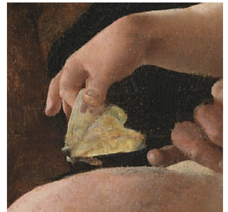
Figuur 2. Detail van Rust tijdens de vlucht naar Egypte, Maerten van Heemskerck, ca. 1530, National Gallery of Art, Washington DC.