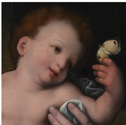
Figuur 3. Detail van Maagd met kind, Cornelis Cleve, ca. 1550, Minneapolis Institute of Art, Minneapolis.