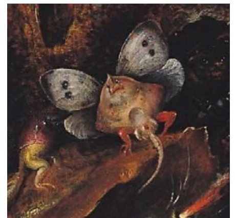
Figuur 4. Detail van De Verzoeking van de Heilige Antonius, Pieter Schoubroeck, 16de eeuw, Musée des Beaux-Arts, Duinkerken.