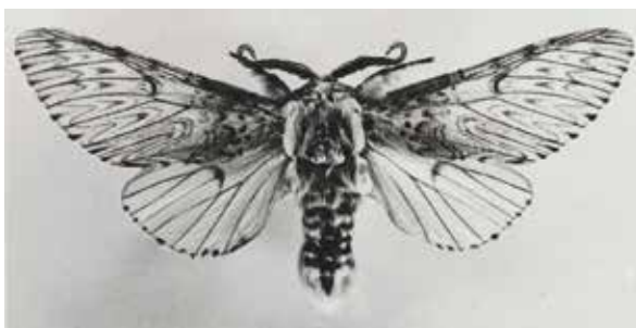
Hermelijnavlinder Deurne, de Markt 5 mei 1956.

Op 5 mei 1956 tijdens het bevrijdingsconcert van de harmonie op de markt — ik mocht anders nog