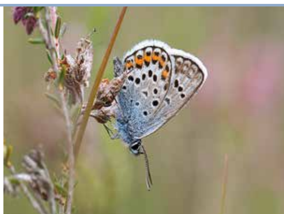
Chris van Swaay

Gemiddeld aantal vlinders per telling in de beste drie vlinderweken in de zomer (blauwe lijn). In de zomer van 2013 was het heideblauwtje extreem talrijk op een paar routes. Gebruiken we voor die weken de gemiddelde waarde van de vorige jaren voor deze soort, dan zou het gemiddeld aantal vlinders wel een stuk omlaag gaan (de dikke blauwe stip). Het blijft nog steeds een puike vlinderzomer, maar iets minder extreem dan de lijn suggereert.