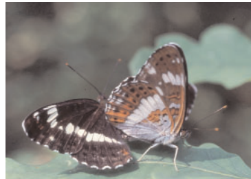
kleine ijsvogelvlinder: baat hij hoge grondwaterstand