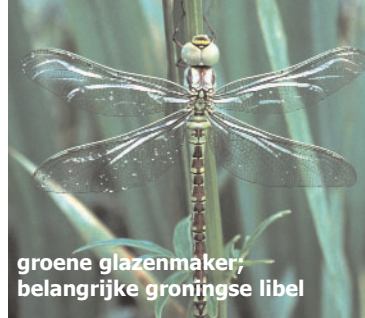
groene glazenmaker; belangrijke groningse libel

Onderzoek naar de relatie tussen het voorkomen van het bont dikkopje en de kleine ijsvogelvlinder in Noord-Brabant, laat zien dat beide soorten vooral worden gevonden in bossen met een hoge grondwaterstand. De meeste bossen in Brabant hebben een te lage grondwaterstand, wat een van de verklaringen is voor de achteruitgang van deze soorten.