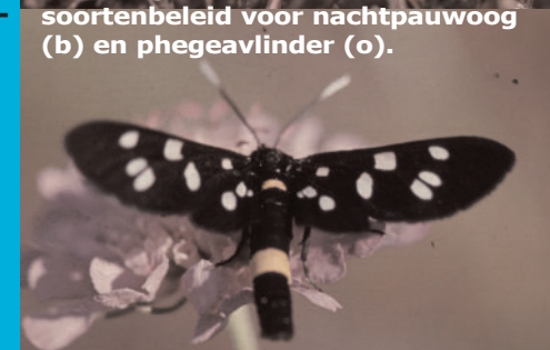
aan het werk voor bijzondere soorten in ede zoals bruine vuurvlieder (b) en heivlieder (o).