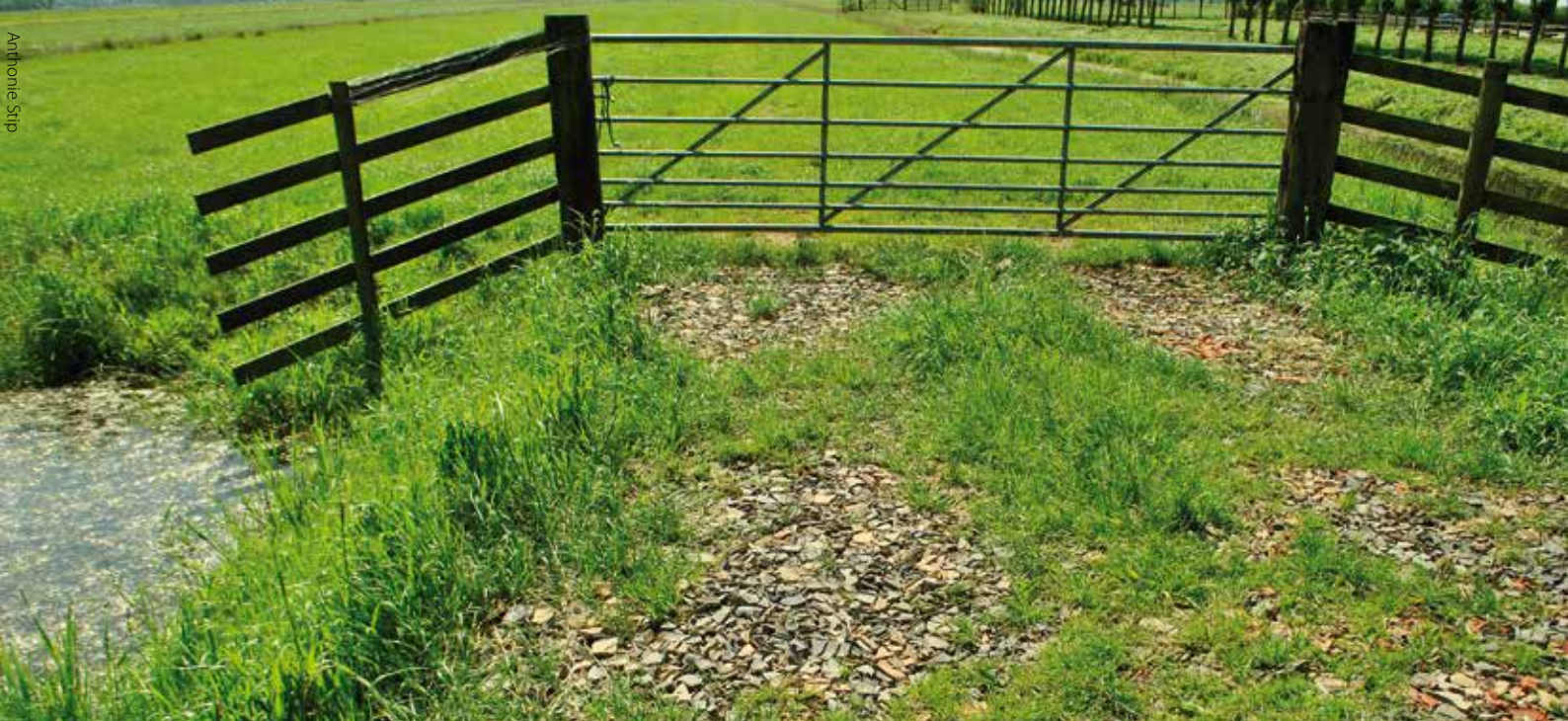
Perceelsgangen in het laagveengebied blijken ideale locaties om argusvlinders aan te treffen. Kale grond (opwarmen) en een verticale structuur (voortplanting) zijn aanwezig. Brandwijk (ZH).

maar een paar plekken gevonden. De beste provincies voor argusvlinders bleken Noord-Holland, Zuid-Holland en Friesland te zijn, in die volgorde (Tabel 1). Daar werd in tenminste 70% van de getelde kilometerhokken een argusvlinder gezien. Drenthe en Groningen bleken argusloze provincies tijdens het telweekend. In de kop van Overijssel, in de Olde Maten ten oosten van Hasselt, werden in totaal nog 20 argusvlinders geteld, en dat zijn forse aantallen voor een regio waar de soort verder nauwelijks nog aan te treffen is. In Gelderland was alleen het uiterste westen van het rivierengebied nog bezet, bijvoorbeeld rondom Culemborg. Eén exemplaar werd in Voorthuizen gezien. Brabant moest het hebben van de kleipolders in het land van Heusden en Altena, een enkel exemplaar in de Moerputten en in het uiterste westen van de provincie. Op het heuvelland na werd er in Limburg niet geteld, maar waarschijnlijk is de soort buiten die regio ook niet meer aanwezig. In Utrecht was de argusvlinder met name in het vochtige westelijke provinciedeel aanwezig. Deelname uit Flevoland bleef helaas uit, maar zijn de 'nieuwe' polders echt verstoken van argusvlinders? Dat willen we graag nog weten.