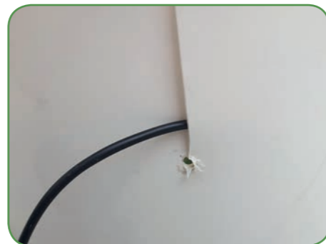
Breng het snoer voorzichtig omlaag tot het gaatje.

Let op: Breng het snoer omlaag tot het gaatje onder in de sleuf. Doe dit erg voorzichtig, anders kan het snoer hierbij beschadigd worden. Om die reden wordt aanbevolen om het snoer na gebruik in de emmer te laten zitten.