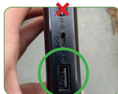
Gebruik bij voorkeur de USB-aansluiting met één bliksemschicht.

Let op: Er zijn twee verschillende USB-aansluitingen. Die met één bliksemschicht erop verbruikt veel minder stroom dan die met twee, en het is dan ook aan te raden deze aansluiting te gebruiken.