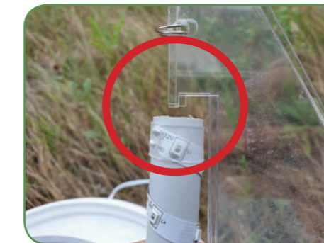
Schuif het buisje over de puntjes van de plaatjes.