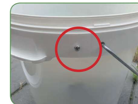
Dit is de schroef voor de lichtsensor.