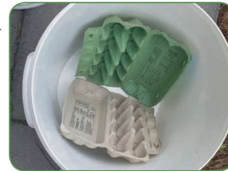
Zet twee eierdozen rechtop in de emmer.

Let op: Er zijn twee verschillende USB-aansluitingen. Die met één bliksemschicht erop verbruikt veel minder stroom dan die met twee, en het is dan ook aan te raden deze aansluiting te gebruiken.