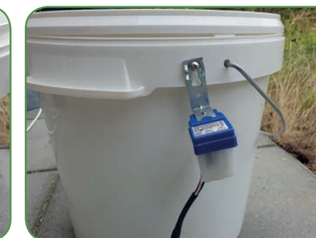
De lichtsensor wordt bevestigd aan de schroef.