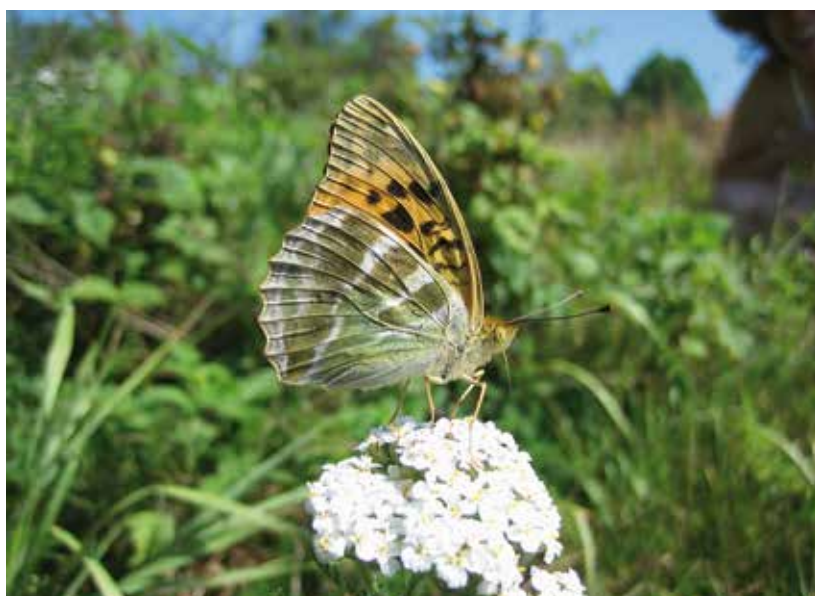
Arthur van Dijk

In de vorige eeuwen moet de keizersmantel wijd verbreid geweest zijn. Gek genoeg zie je dat juist aan het ontbreken van speciale aandacht. De soort werd in artikelen slechts in bijzinnen genoemd (en was dus blijkbaar geen speciale vermelding waard) en iedere verzamelaar had al gauw een tiental exemplaren in zijn collectie. In 1853 beperkt De Graaf zich tot 'in Gelderland dikwijls gevangen' en Lempke schrijft in 1936: 'In boschachtige streken in het N., O. en Z., soms gewoon, maar meestal weinig talrijk. Een enkele maal in het W. waargenomen.' Wie de keizersmantel uit het buitenland kent, weet dat het vaak een buitengewoon talrijke vlinder kan zijn. Maar blijkbaar was de soort in 1936 al niet meer heel talrijk. Daarbij wordt de situatie vertroebeld doordat de keizersmantel een krachtige vlieger en zwerver is, die op allerlei plekken kan opduiken.