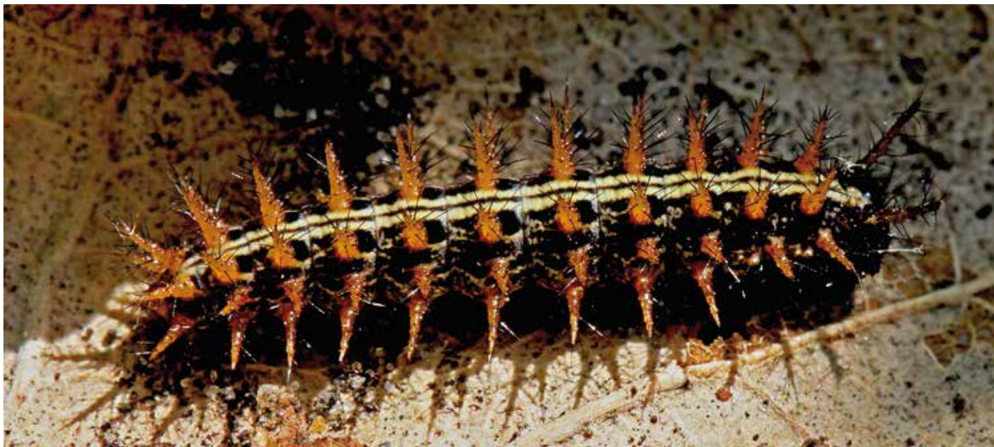
Rups van de keizersmantel, gefotografeerd in Zwolle.

uitkomt worden andere viooltjes ook gewoon gegeten. Eigenlijk lijkt het erop dat de keizersmantel alle viooltjes kan eten, zolang het maar in een bosachtige omgeving is.