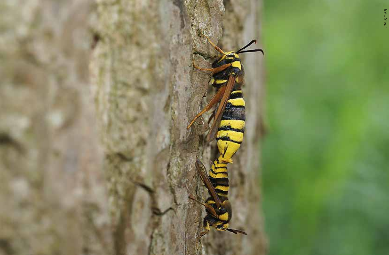
Hoornaarvlinders voelen zich thuis in de Schijndelse populierenweide.

(bij 's-Hertogenbosch aan de noordelijke rand van Het Groene Woud) worden omgevormd tot volwaardige blauwgraslanden waar het pimpernelblauwtje in de nabije toekomst leefgebied kan vinden (het project Blues in the Marshes, waarin ook De Vlinderstichting participeert).