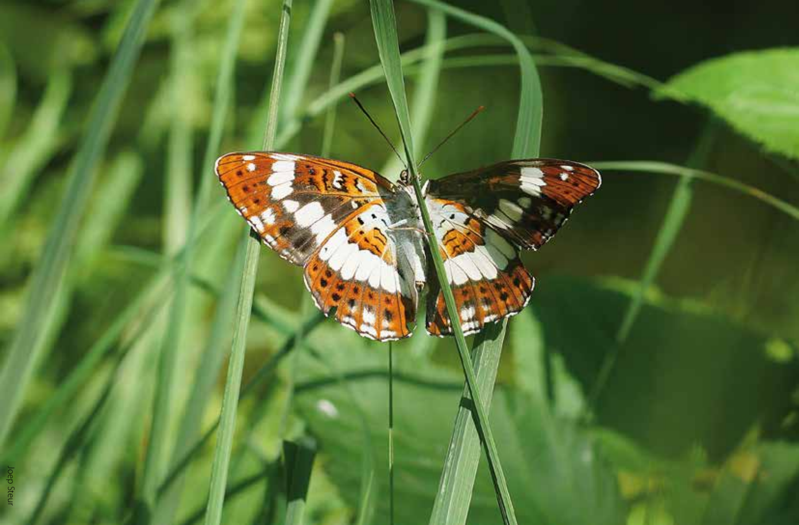
Kleine ijsvogelvlinder in de Geelders.

beeld bij het uitvoeren van vlindervriendelijke maatregelen door diverse betrokken terreineigenaren en NMC Schijndel. Ook hielp het boek geënthousiasmeerde particulieren bij het vlindervriendelijk maken van hun lapje grond. Er worden gratis begeleide vlinderwandelingen en nachtvlinderavonden georganiseerd. En er zijn vlinderwandelfolders van de in het boek beschreven gebieden uitgegeven en ook een grote vlinderposter van de gesignaleerde dagvlinders in Het Groene Woud. Voor basisscholen en jeugdnatuurgroepen in de regio is een digitaal lespakket samengesteld met de titel 'Vera de Vlinder'. Dit alles onder de paraplu van de zeer actieve Stichting Natuurprojecten Schijndel. Met al deze maatregelen hopen we de vlinders een solide basis te geven voor verder herstel in de toekomst en zal Het Groene Woud uiteindelijk nog een stuk groener worden dan het al was!