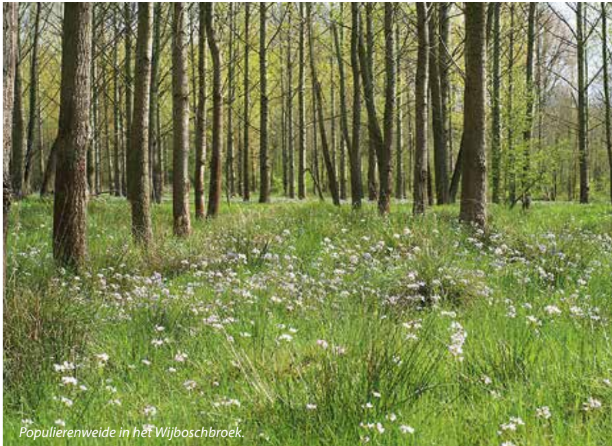
Populierenweide in het Wijboschbroek.