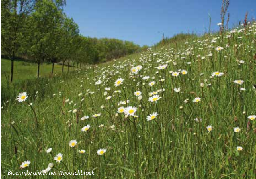
Bloerijke dijk in het Wijboschbroek.