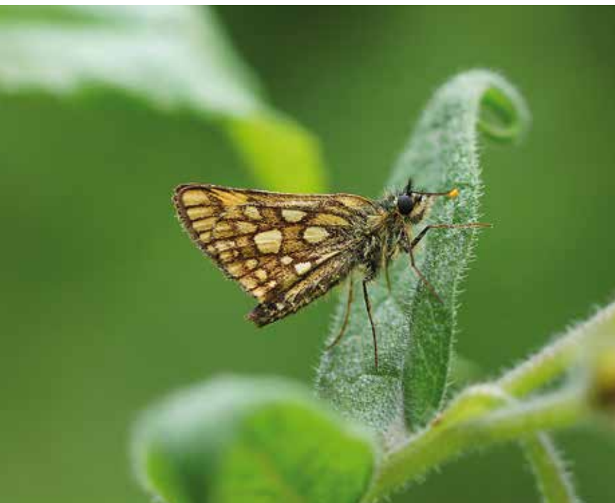
Bont dikkopje, De Scheeken.

De bijzondere leembossen vormen tezamen met de andere biotopen een gevarieerd mozaïeklandschap