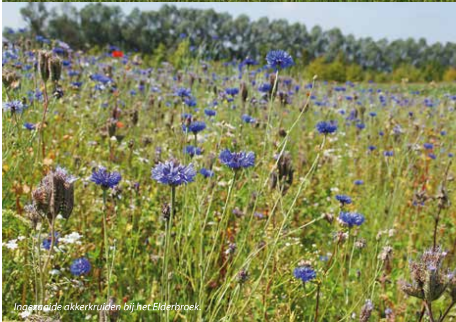
Ingezaaide akkerkruiden bij het Elderbroek.