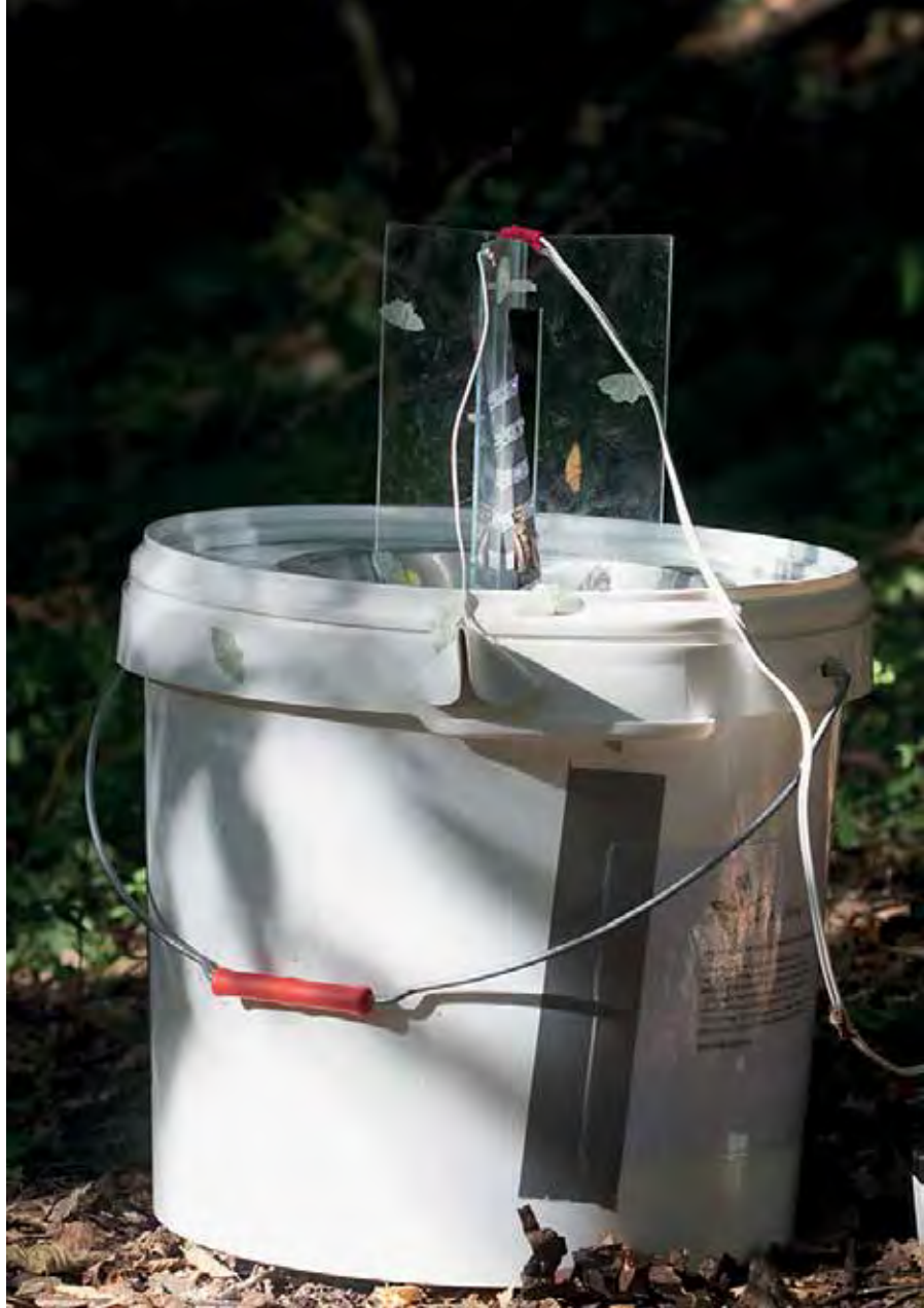
De nieuwe nachtvlinderval werkt met led in plaats van tl-buisjes.

Voor het meetnet nachtvlinders zijn we nog hard op zoek naar extra meetpunten. Alle waarnemingen die met een val zijn gedaan, zowel in tuinen, natuurgebieden als agrarische gebieden, zijn welkom. Wilt u meekeden, kijk dan hoe het werkt op de pagina van het Landelijk Meetnet Nachtvlinders op www.vlinderstichting.nl .