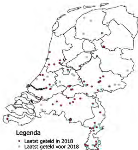
Figuur 1. Alle getelde meetpunten over alle jaren. Van de rode stippen zijn de gegevens van 2018 al binnen.

Tekst: In Noctua, het databestand van De Vlinderstichting en de Werkgroep Vlinderfaunistiek, staan momenteel al meer dan 6.000.000 nachtvlinderwaarnemingen. Deze waarnemingen zijn onder andere afkomstig uit waarneming.nl en telmee.nl, maar ook van losse waarnemingslijstjes. Deze gegevens worden gebruikt om verspreidingskaartjes en vliegtijd diagrammen te maken, maar om iets over de veranderingen in aantallen te kunnen zeggen zit te veel verschil tussen al deze waarnemingen. Dat komt onder andere doordat mensen af en toe een waarneming doorgeven, andere mensen van elke soort één exemplaar doorgeven en weer andere tellingen of schattingen doen van de aantallen. Daarnaast zijn er grote verschillen in het type lamp dat mensen gebruiken; ook dat heeft een grote invloed op de hoeveelheid vlinders die worden gevangen. Ook is er nog verschil in tijdsduur: sommige mensen vangen een hele nacht en andere slechts een paar uurtjes.